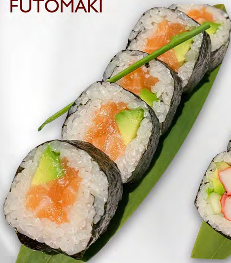
150 - FUTU SAKE Futo con salmone ed avocado Allergeni: 4