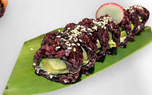
283 - URAMAKI BLACK VEGETARIANO Alghe, cetriolo, avocado, insalata, philadelphia, all'esterno sesamo Allergeni: 7, 11