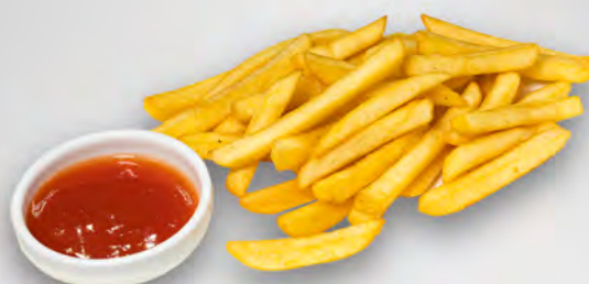
013 - PATATINE FRITTE Allergeni: 1