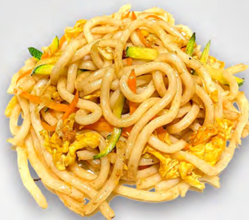
043 - YAKI UDON CON VERDURE Udon saltato con verdure mista ed uova Allergeni: 1, 3