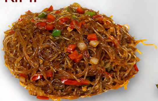
046 - SPAGHETTI DI SOIA PICCANTE Spaghetti di soia con carne di suino, salsa piccante, cipolle e peperoni Allergeni: 6