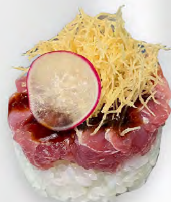
211 - TARTAR RISO TUNA Riso con tonno, kataifi con salsa teriyaki Allergeni: 1, 4