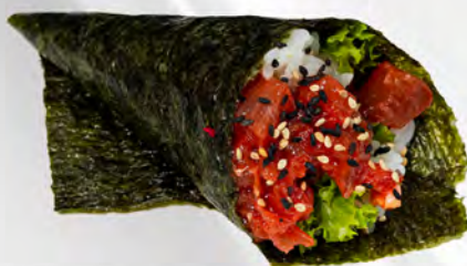
184 - TEMAKI SPICY TUNA Cono di riso con avocado, tonno e maionese piccante Allergeni: 3, 4