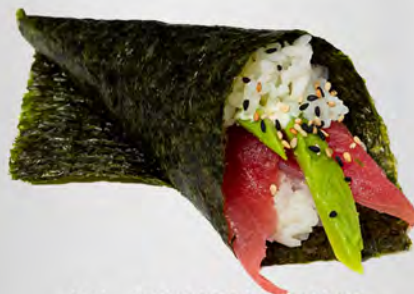
181 - TEMAKI MAGURO Cono di riso con tonno ed avocado Allergeni: 4