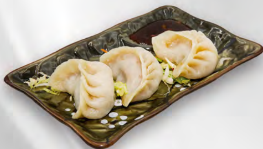
003 - RAVIOLI DI CARNE AL VAPORE 3PZ Farina, carne di maiale Allergeni: 1