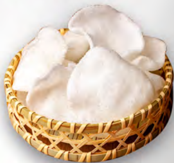
010 - NUVOLE DI GAMBERI Nuvole di gamberi fritti croccante Allergeni: 1, 2