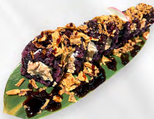
280 - URAMAKI BLACK MIURA Alghe, riso venere, salmone cotto, philadelphia, all'esterno cipolla fritto, teriyaki Allergeni: 1, 4, 7