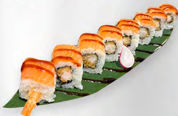
263- TIGER ROLL Alghe, tempura gamberi, all'esterno salmone, teriyaki Allergeni: 1, 2, 4