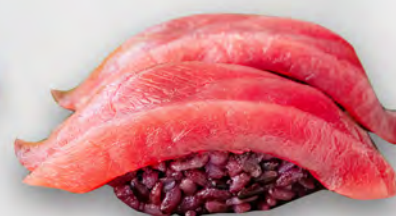
I27 - NIGIRI MAGURO BLACK 2PZ Tonno e riso venere Allergeni: 4