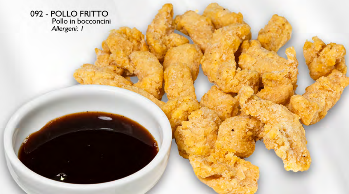
092 - POLLO FRITTO Pollo in bocconcini Allergeni: 1