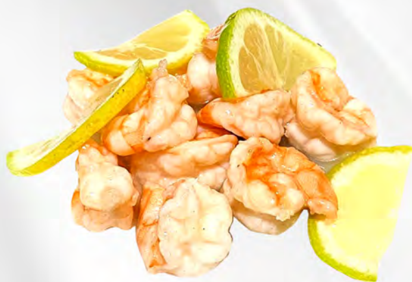
072 - GAMBERI LIMONE Gamberi in salsa limone Allergeni: 2