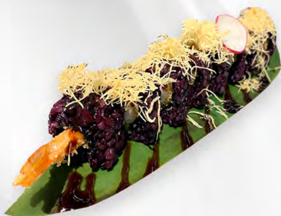
281 - URAMAKI BLACK EBITEN Alghe, riso venere, tempura gamberi, teriyaki, sesamo, kataifi, teriyaki Allergeni: 1, 2, 11