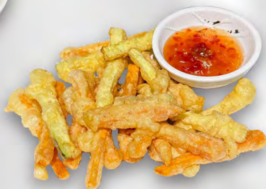
089 - KAKI AGE Verdure miste tagliati sottili fritto Allergeni: 1