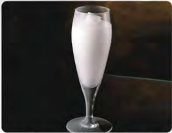
Sorbetto al limone €3.50 Gelato al limone, limoncello, latte.