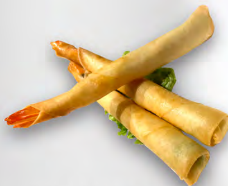
002 - EBI HARUMAKI 2PZ Involtini gamberi Allergeni: 1, 2