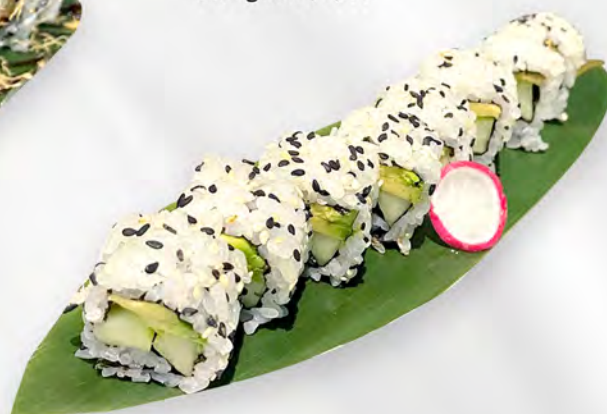
254 - URAMAKI VEGETARIANO Alghe, avocado, cetriolo, sesamo Allergeni: 11