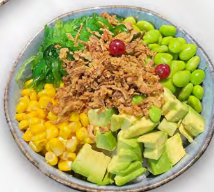
202 - POKE YASAI Avocado, goma wakame, edamame, mais, cipolla croccante Allergeni: 1, 6