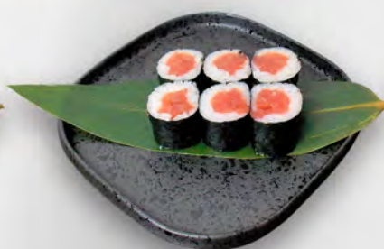
141 - HOSO MAGURO Tonno Allergeni: 2