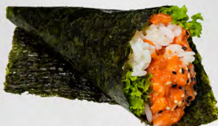
183 - TEMAKI SPICY SALMONE Cono di riso con avocado, salmone e maionese piccante Allergeni: 4