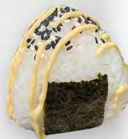
193 - ONIGIRI SPICY TUNA Riso con tonno, salsa maionese piccante e sesamo Allergeni: 3, 4, 11