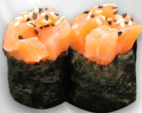
166 - GUNKAN SALMONE Salmone con alghe e salsa maionese piccante Allergeni: 3, 4