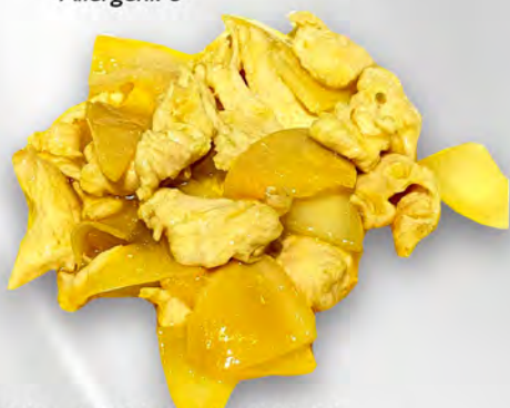
062 - POLLO AL CURRY Pollo saltato con le verdure miste al curry