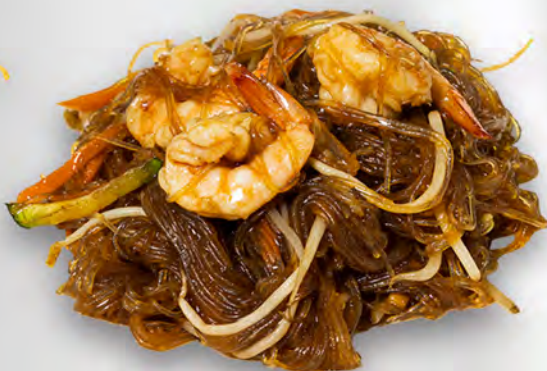
047 - SPAGHETTI DI SOIA CON FRUTTI DI MARE Spaghetti di soia con verdure e frutti di mare mista Allergeni: 2, 4, 6, 14