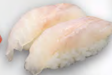
I22 - NIGIRI SUZUKI 2PZ Branzino Allergeni: 4