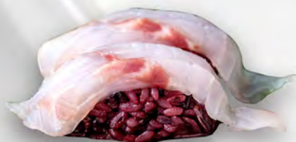
I28 - NIGIRI SUZUKI BLACK 2PZ Branzino e riso venere Allergeni: 4