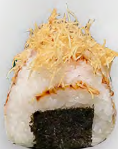
192 - ONIGIRI SPICY SALMONE Riso con salmone crudo e salsa maionese piccante Allergeni: 3, 4