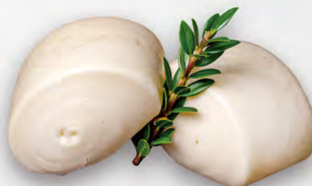
007 - PANE ORIENTALE 2PZ Pane soffice dolce al vapore Allergeni: 1, 7