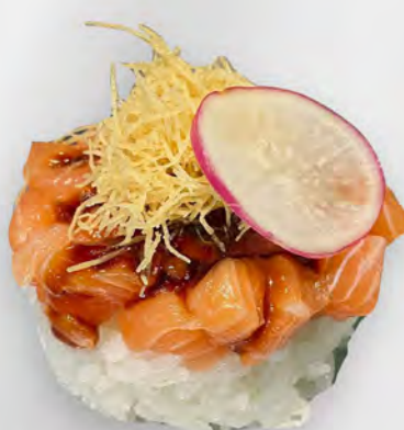
210 - TARTAR RISO SALMONE Riso con salmone, kataifi con salsa teriyaki Allergeni: 1, 4