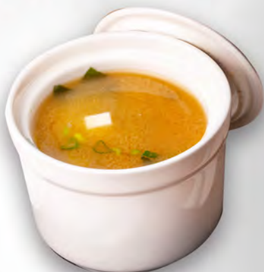
026 - ZUPPA MISO Tofu, alghe Allergeni: 6