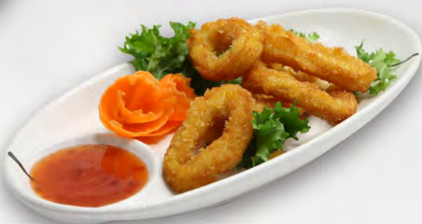
090 - IKA TEMPURA Tempura di calamari Allergeni: 1, 14