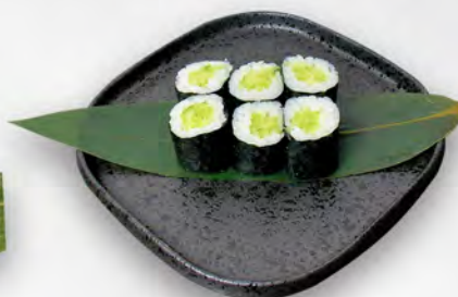
148 - HOSO KYUKI Cetriolo ed avocado