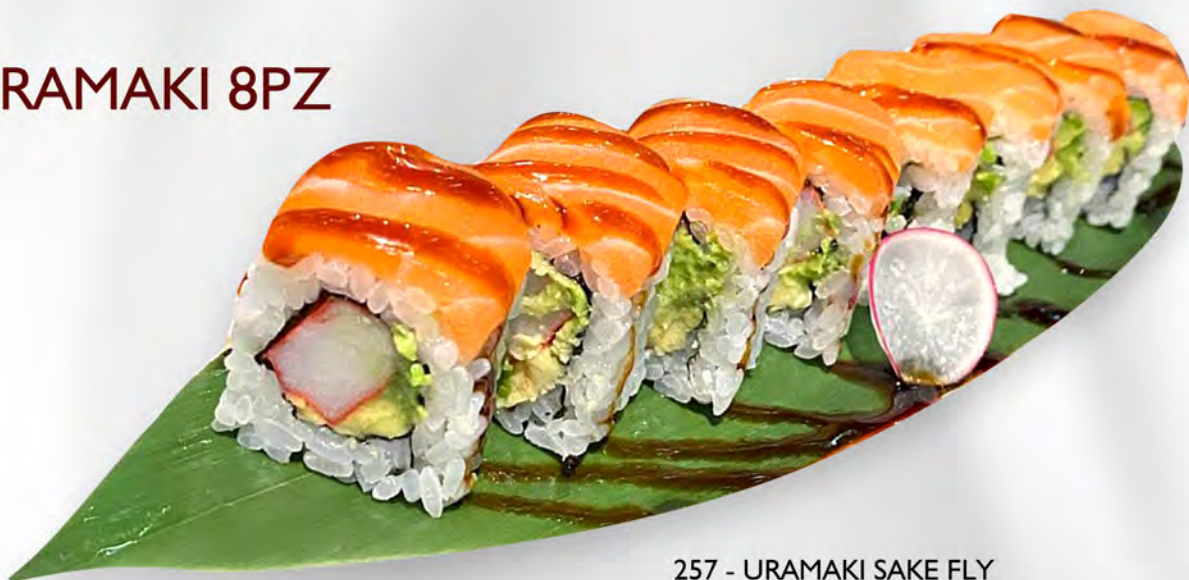
257 - URAMAKI SAKE FLY Alghe, granchio, avocado, all'esterno salmone, teriyaki Allergeni: 1, 2, 4