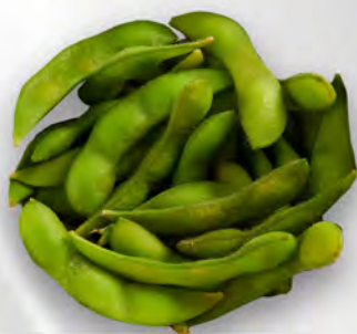
012 - EDAMAME Baccelli di soia bolliti Allergeni: 6