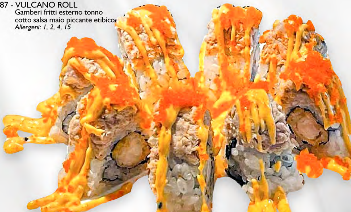
287 - VULCANO ROLL Gamberi fritti esterno tonno cotto salsa maio piccante etibico Allergeni: 1, 2, 4, 15