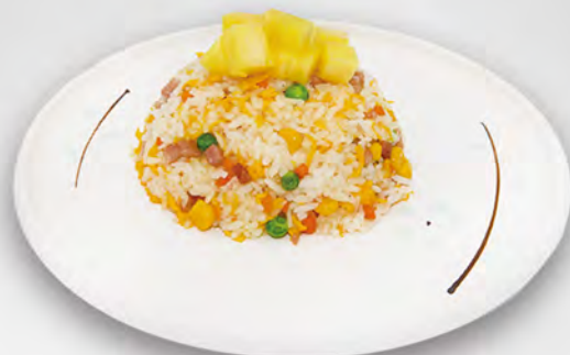
038 - RISO TAILANDESE Ananas, verdure miste, uova e salsa thailandese e gamberi Allergeni: 2, 3