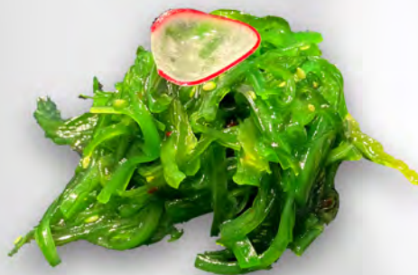
011 - GOMA WAKAME Alge marinate dolci con i semi di sesamo Allergeni: 11