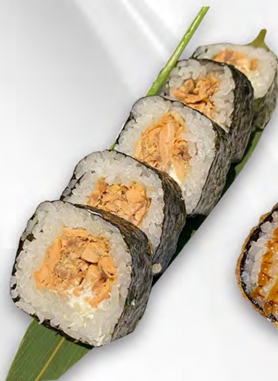
152 - FUTU MIURA Futo con salmone cotto e philadelphia Allergeni: 4, 7