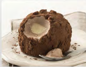
Tartufo classico €4.50 Gelato semifreddo allo zabaione e gelato al cioccolato, decorato con granella di nocciole e cacao.