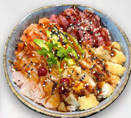
201 - POKE KAISEN Riso con salmone, tonno, branzino, avocado e tempura di gamberi Allergeni: 1, 2, 4