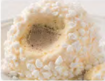
Tartufo bianco €4.50 Gelato semifreddo allo zabaione con cuore di gelato al caffè decorato con granella di meringa.