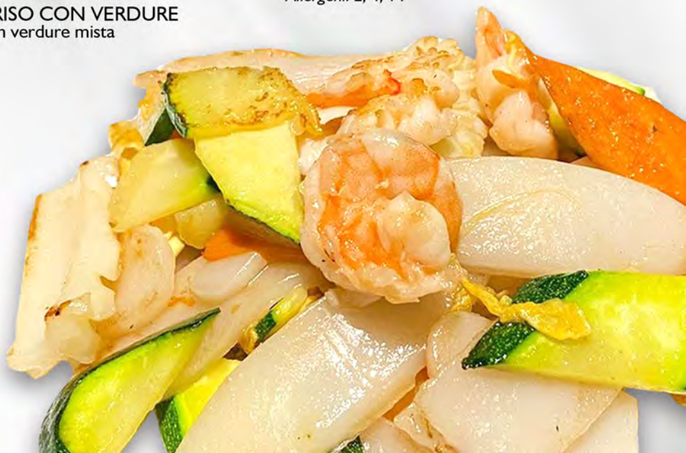
040 - GNOCCHI CON FRUTTI DI MARE Gnocchi di riso saltato con verdure, frutti di mare mista Allergeni: 2, 4, 14