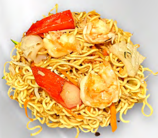
042 - RAMEN SALTATO CON FRUTTI DI MARE Ramen saltato con frutti di mare mista, verdura ed uova Allergeni: 1, 2, 3, 4, 14