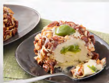
Crocante al pistacchio €4.50 Dessert semifreddo con crema al pistacchio con cuore al pistacchio, decorato con granella di mandorle caramellate.