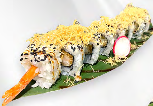
253 - URAMAKI EBITEN Alghe, gamberi in tempura, teriyaki, kataifi, sesamo Allergeni: 1, 2, 11