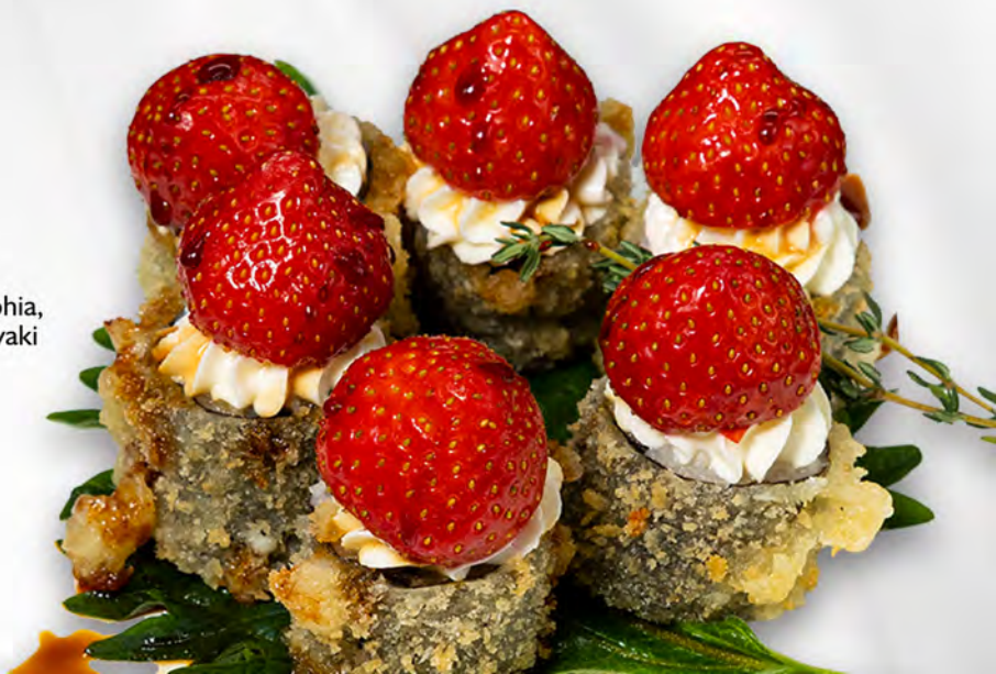
147 - HOSO FRUIT Salmone, philadelphia, fragola e salsa teriyaki Allergeni: 1, 4, 7