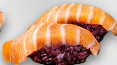
I26 - NIGIRI SAKE BLACK 2PZ Salmone e riso venere Allergeni: 4