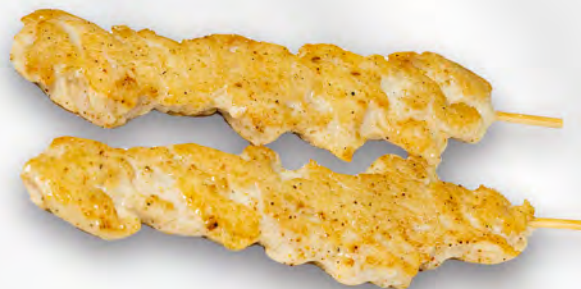
105 - SPIEDINI DI POLLO 2PZ Spiedini di pollo