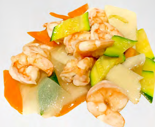
071 - GAMBERI CON VERDURE Gamberi saltato con le verdure miste Allergeni: 2