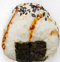
190 - ONIGIRI MIURA Salmone cotto e salsa teriyaki, philadelphia Allergeni: 1, 4, 7