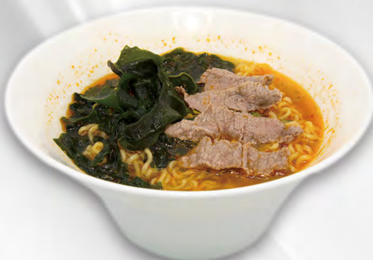
028 - RAMEN CON MANZO Ramen in brodo con manzo e verdure miste Allergeni: 1