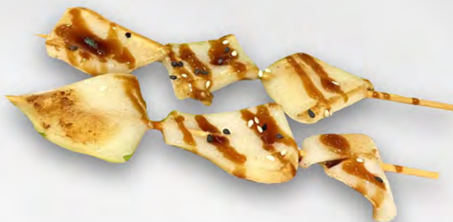
103 - IKA TEPPAN 2PZ Spiedini di calamari Allergeni: 14