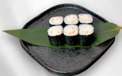
143 - HOSO EBI Gamberi cotto Allergeni: 2