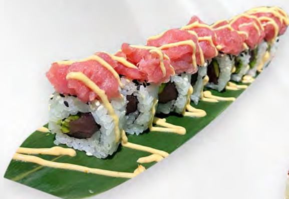
260 - URAMAKI SPICY TONNO Alghe, tonno crudo, avocado, sesamo, all'esterno tartare tonno spicy Allergeni: 4, 11