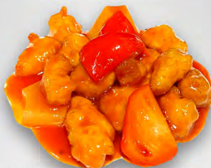
063 - POLLO IN AGRODOLCE Pollo fritto in agrodolce con ananas e peperoni Allergeni: 1