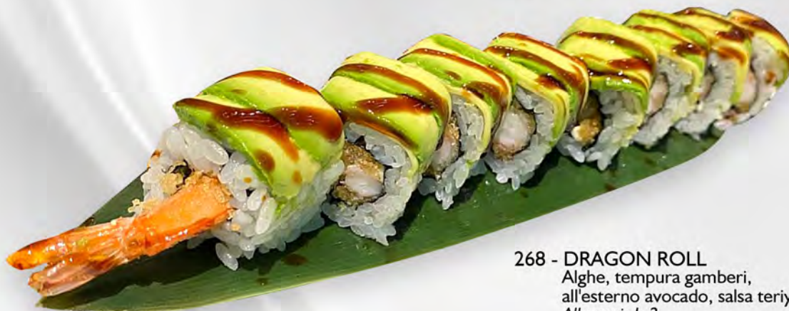
268 - DRAGON ROLL Alghe, tempura gamberi, all'esterno avocado, salsa teriyaki Allergeni: 1, 2