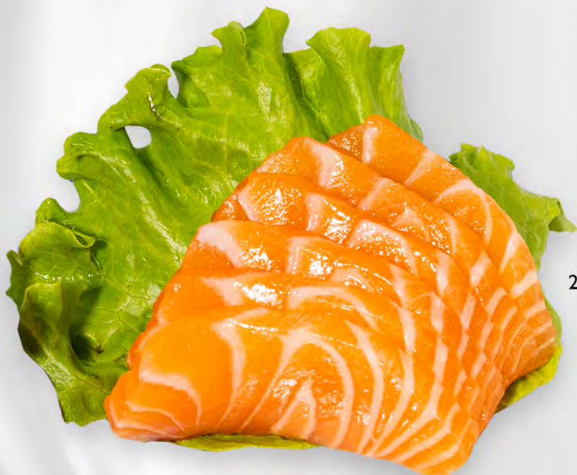
226 - SASHIMI SAKE 4PZ Salmone Allergeni: 4 Massimo 3 porzione a persona