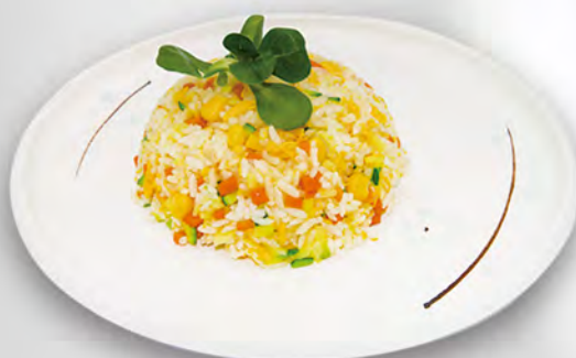
033 - RISO CON VERDURE Riso saltato con verdure miste ed uovo Allergeni: 3