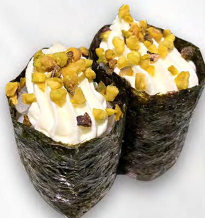
169 - GUNKAN PHILADELPHIA Philadelphia, alghe e pistacchio Allergeni: 7, 8