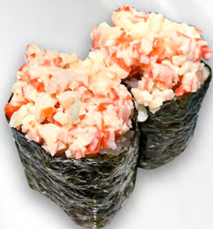
170 - GUNKAN KANI Tartare di granchio e maionese piccante Allergeni: 2, 3