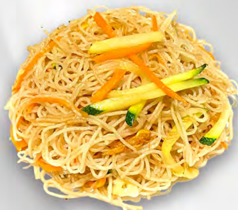
048 - SPAGHETTI DI RISO CON VERDURE Spaghetti di riso saltato con verdure miste, uova Allergeni: 3