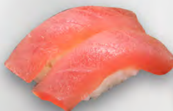
I21 - NIGIRI MAGURO 2PZ Tonno Allergeni: 4