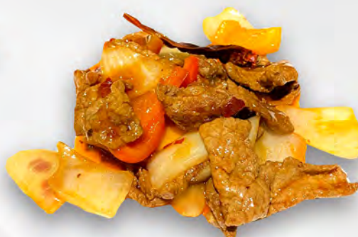
065 - MANZO PICCANTE Manzo piccante con cipolla e peperoni