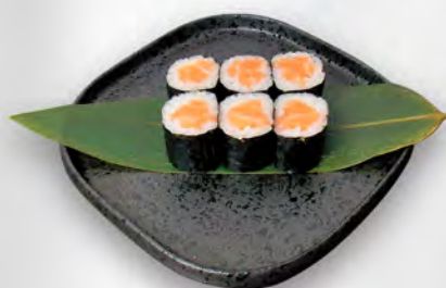
140 - HOSO SAKE Salmone Allergeni: 2