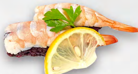
I29 - NIGIRI EBI BLACK 2PZ Gamberi e riso venere Allergeni: 2