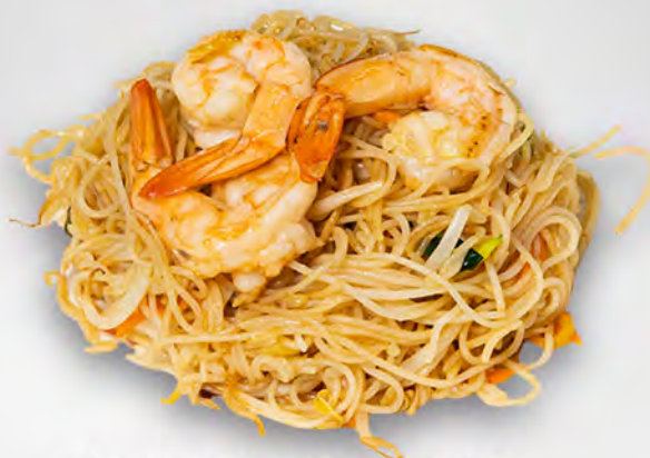
049 - SPAGHETTI DI RISO CON FRUTTI DI MARE Spaghetti di riso saltato con verdure, uova e frutti di mare Allergeni: 2, 3, 4, 14