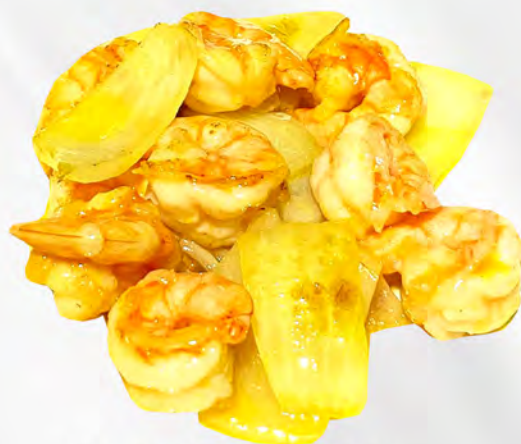
074 - GAMBERI AL CURRY Gamberi saltato con salsa curry e cipolle Allergeni: 2