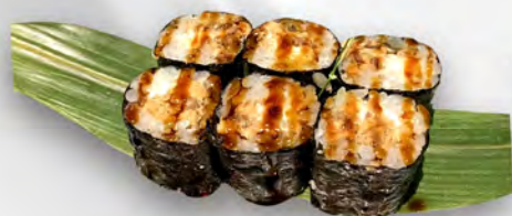
146 - HOSO MIURA Salmone cotto, philadelphia, teriyaki Allergeni: 4, 7