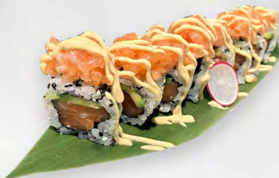
259 - URAMAKI SPICY SALMONE Alghe, salmone, avocado, sesamo, all'esterno tartare salmone spicy Allergeni: 4, 11