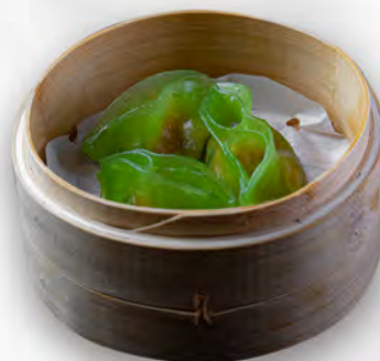
009 - RAVIOLI DI VERDURE 3PZ Farina e verdure miste Allergeni: 1