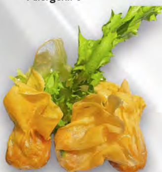
014 - SACCHETTI DI GAMBERI 3PZ Farina, carne e gamberi Allergeni: 1, 2