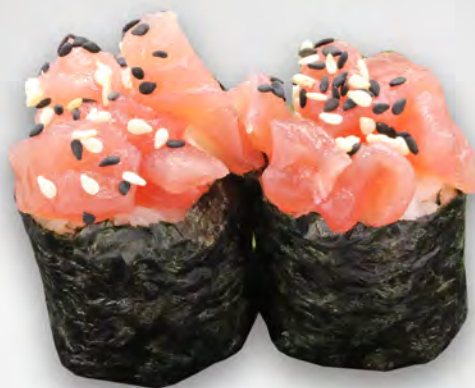
167 - GUNKAN TONNO Tonno con alghe e salsa maionese piccante Allergeni: 3, 4