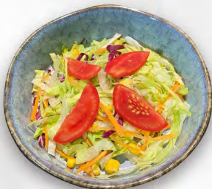
020 - INSALATA MISTA