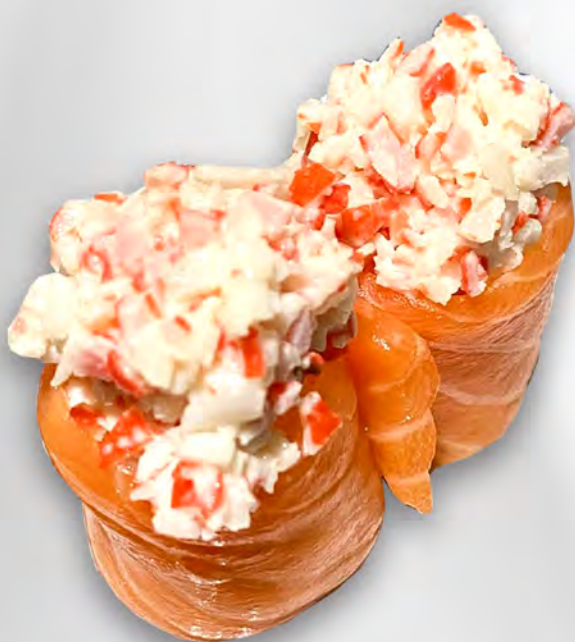
165 - BIGNE KANI Gunkan con salmone, tartare di granchio, maionese piccante. Allergeni: 2, 3, 4