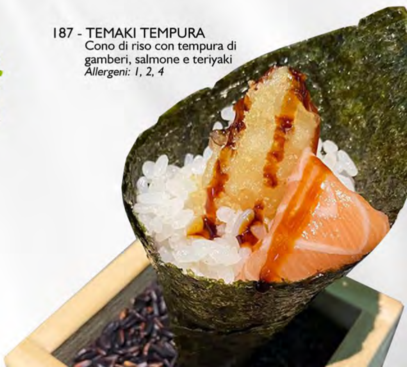
187 - TEMAKI TEMPURA Cono di riso con tempura di gamberi, salmone e teriyaki Allergeni: 1, 2, 4