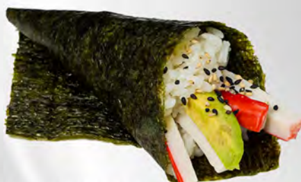
182 - TEMAKI CALIFORNIA Cono di riso con surimi, avocado e maionese Allergeni: 2, 3