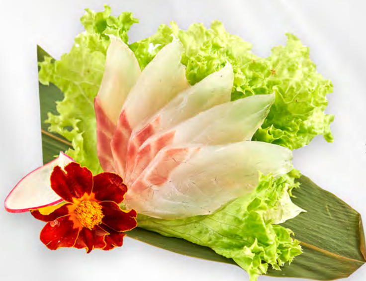
228 - SASHIMI SUZUKI 4PZ Branzino Allergeni: 4 Massimo 3 porzione a persona