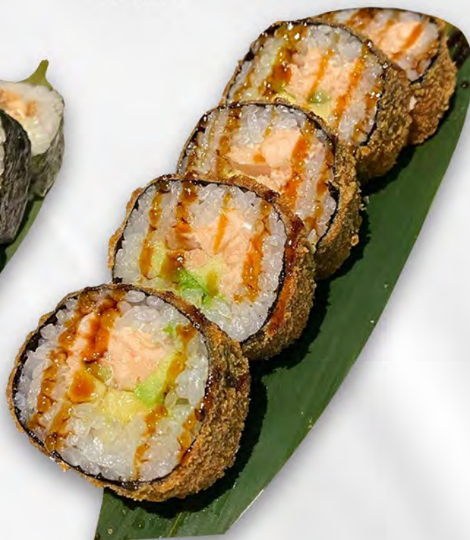
153 - FUTU FRITTO Futo fritto con salmone, avocado, philadelphia e salsa teriyaki Allergeni: 1, 4, 7