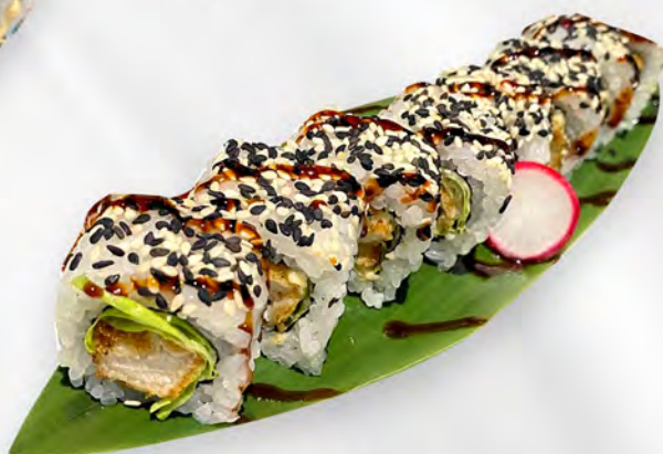
261 - CHICHEN ROLL Alghe, insalata, pollo fritto, maionese, teriyaki Allergeni: 1, 3