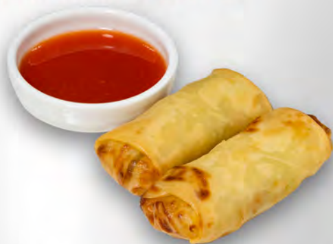
001 - INVOLTINI PRIMAVERA 2PZ Verdure mista Allergeni: 1