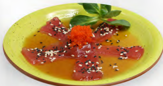
216 - CARPACCIO MAGURO 4PZ Carpaccio di tonno con salsa ponzu e sesamo Allergeni: 4, 11 Massimo 1 porzione a persona