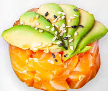
209 - TARTAR BLOOM Tartare di salmone, avocado, philadelphia e salsa teriyaki Allergeni: 1, 4, 7