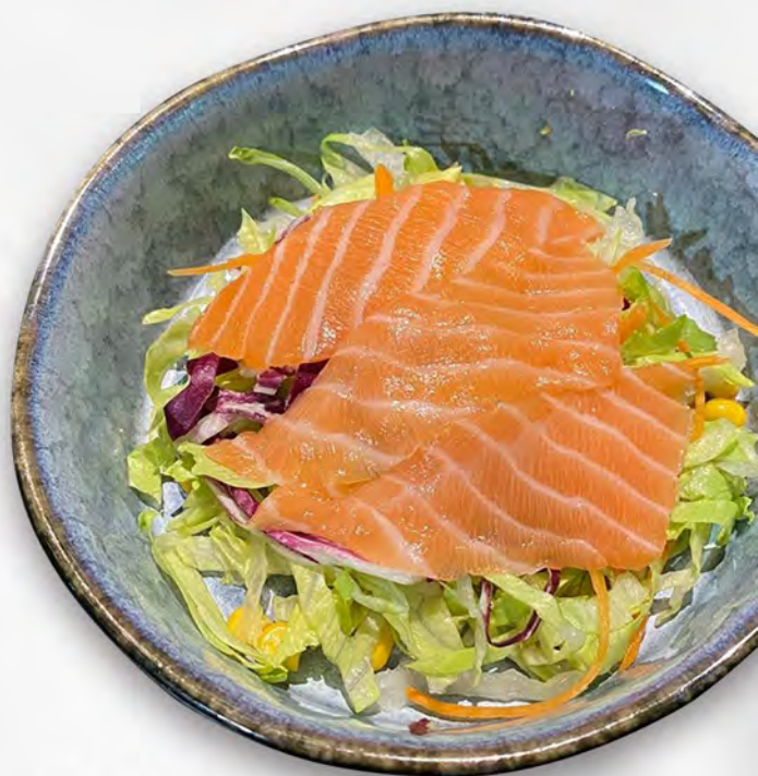
021 - INSALATA SAKE Insalata mista con salmone crudo e salsa di verdure Allergeni: 4