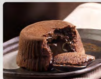
Souffle al cioccolato €4.00 Soufflé con cuore di cioccolato fuso.