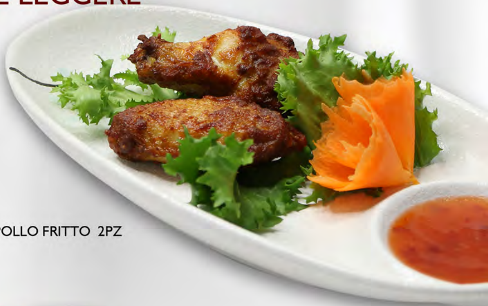
093 - ALETTE DI POLLO FRITTO 2PZ Allergeni: 1