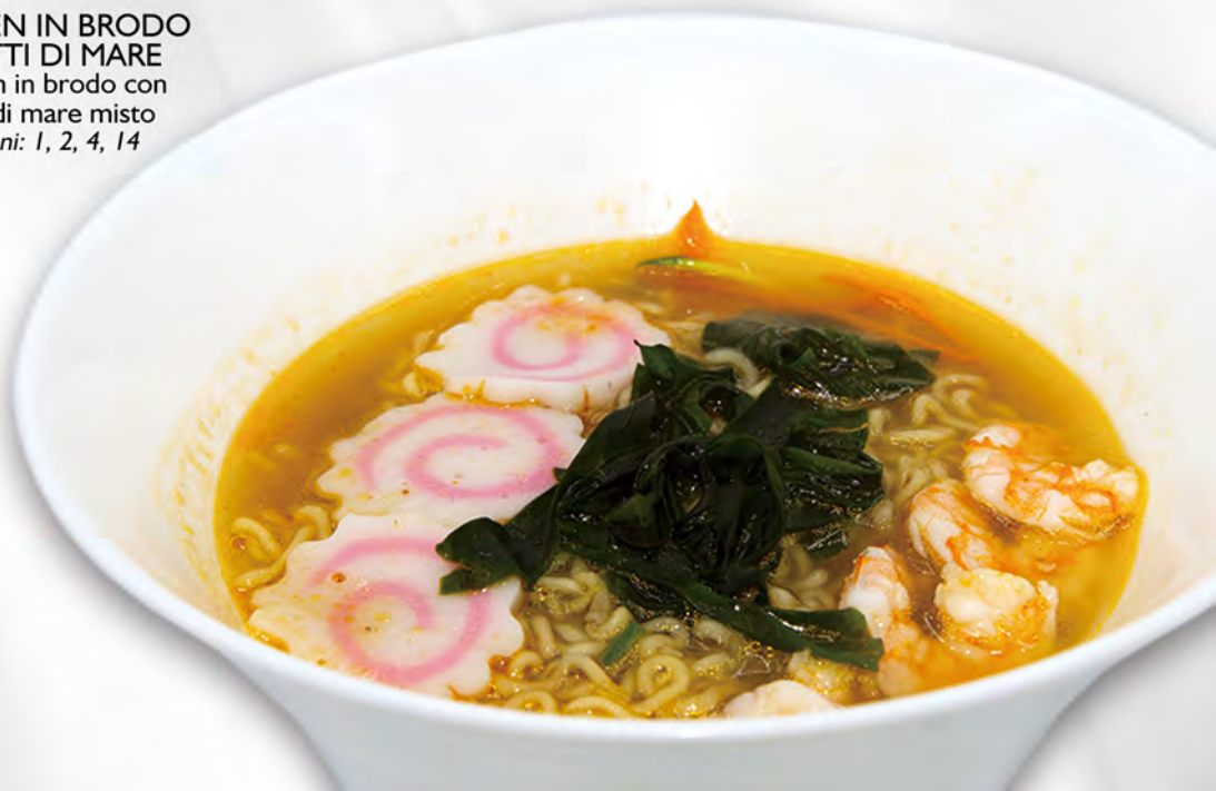
029 - RAMEN IN BRODO FRUTTI DI MARE Ramen in brodo con frutti di mare misto Allergeni: 1, 2, 4, 14