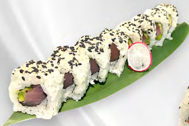
251 - URAMAKI MAGURO Alghe, tonno, avocado, sesamo Allergeni: 4, 11