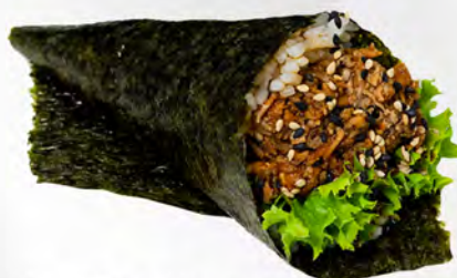
186 - TEMAKI MIURA Cono di riso con salmone cotto e philadelphia Allergeni: 4, 7