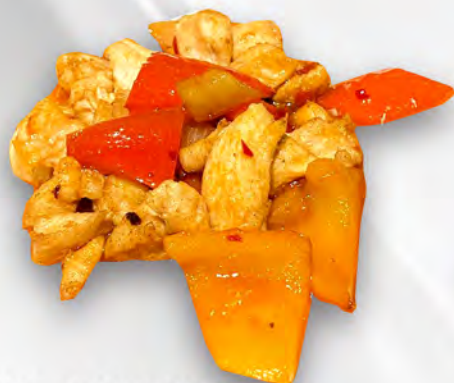
064 - POLLO PICCANTE Pollo saltato piccante con cipolla e peperoni