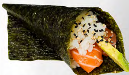
180 - TEMAKI SAKE Cono di riso con salmone ed avocado Allergeni: 4