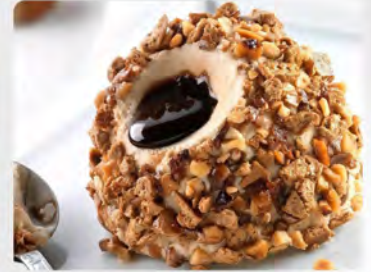
Tartufo nocciola €4.50 Gelato semifreddo alla nocciola con cuore di cioccolato liquido, decorato con nocciole pralinate e meringa.