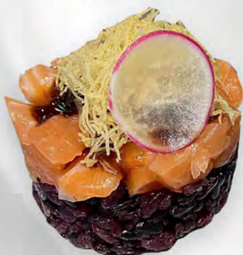
212 - TARTAR RISO BLACK SALMONE Riso venere, salmone, kataifi con salsa teriyaki, philadelphia Allergeni: 1, 4, 7