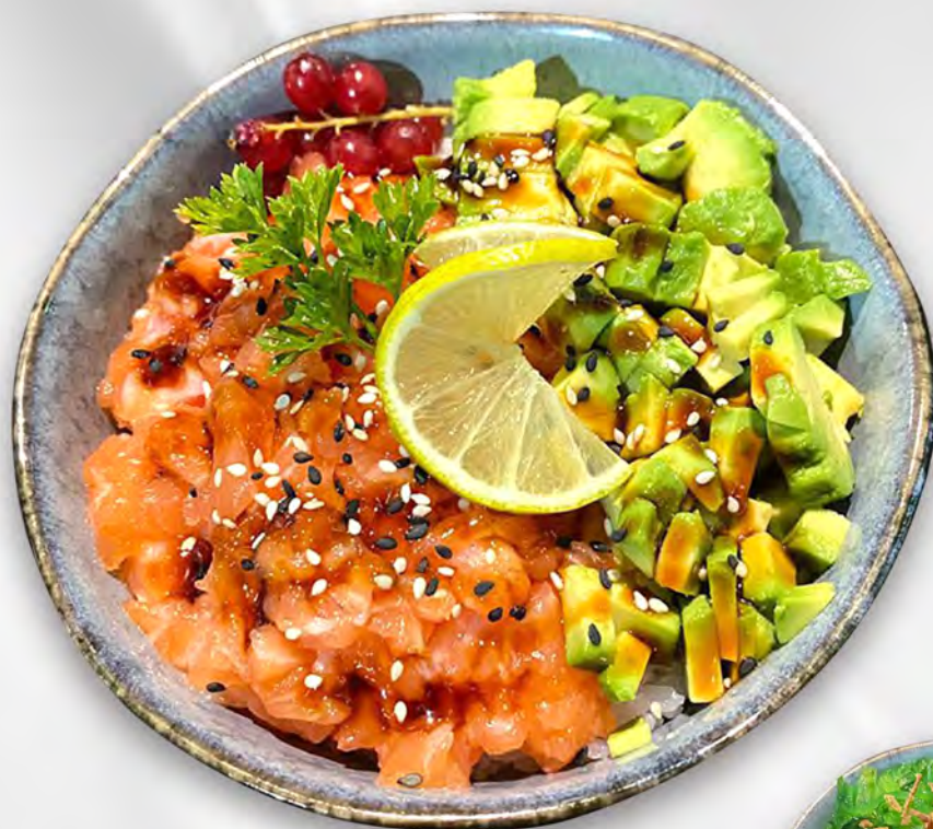
200 - POKE BOWL Riso con salmone crudo, avocado, salsa teriyaki e sesamo Allergeni: 1, 4, 11