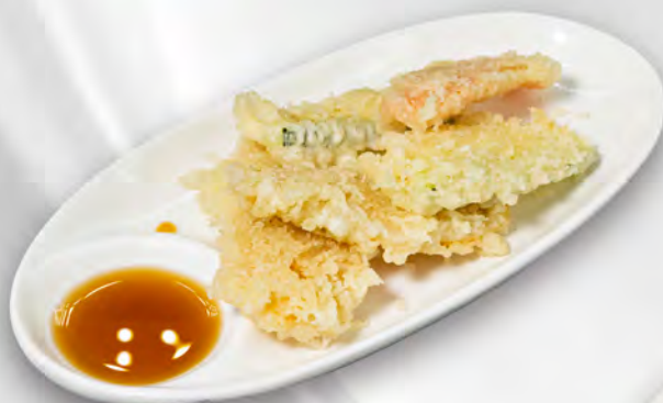
088 - YASAI TEMPURA Tempura di verdure miste Allergeni: 1