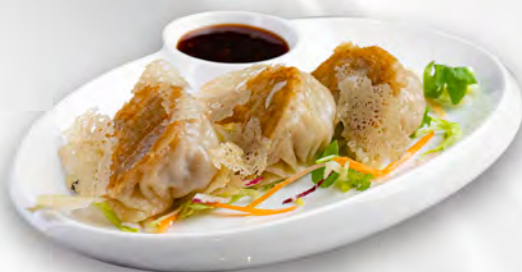
005 - RAVIOLI ALLA GRIGLIA 3PZ Farina, carne di maiale Allergeni: 1