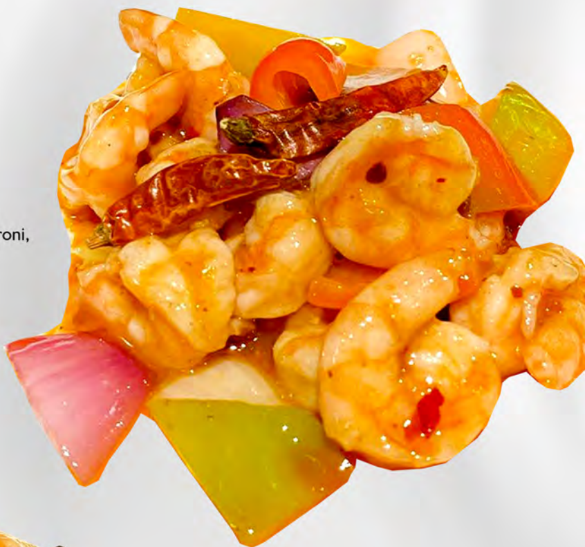
069 - GAMBERI PICCANTE Gamberi saltato con peperoni, cipolla in salsa piccante Allergeni: 2