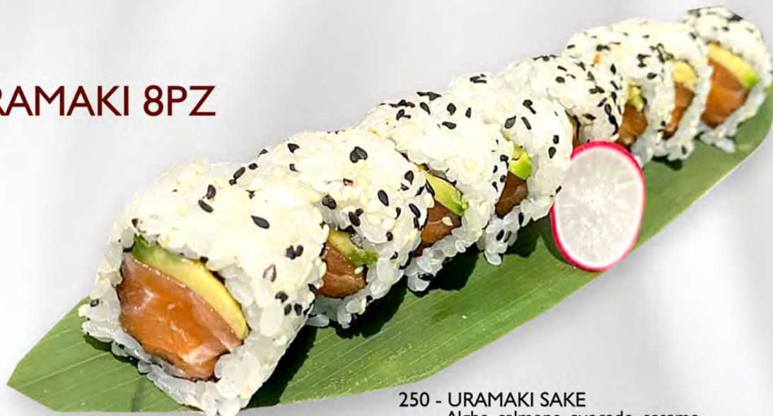
250 - URAMAKI SAKE Alghe, salmone, avocado, sesamo Allergeni: 4, 11