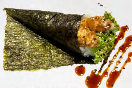
185 - TEMAKI EBITEN Cono di riso con tempura di gamberi e teriyaki Allergeni: 1, 2