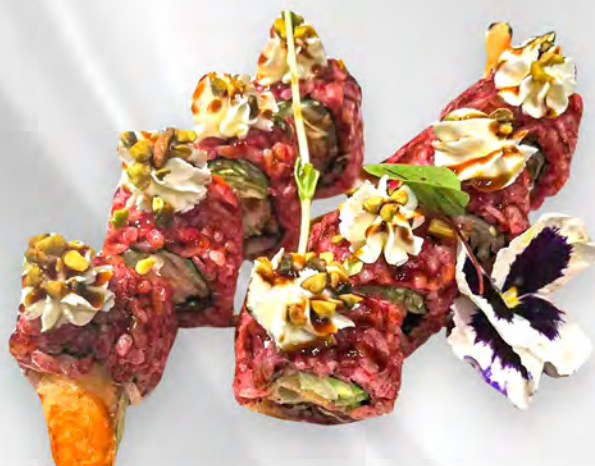
289 - MING ROLL Riso rosso tempura di gamberi philadelphia, insalata teriyaki, pistacchi Allergeni: 1, 2, 7, 8