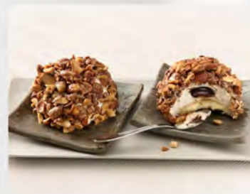
Crocante alle mandorle €4.50 Dessert semifreddo con crema alla nocciola, cuore morbido al cioccolato, decorato con mandorle caramellate.