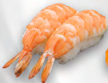
I23 - NIGIRI EBI 2PZ Gamberi cotto Allergeni: 2