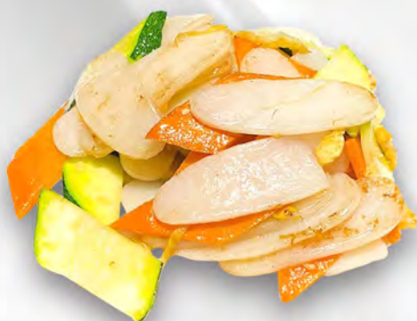
039 - GNOCCHI DI RISO CON VERDURE Gnocchi saltati con verdure mista