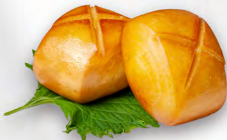
008 - PANE FRITTO 2PZ Allergeni: 1, 7