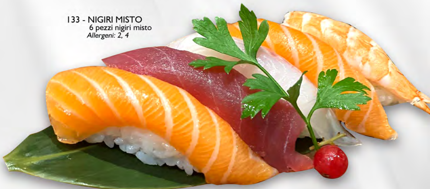
I33 - NIGIRI MISTO 6 pezzi nigiri misto Allergeni: 2, 4