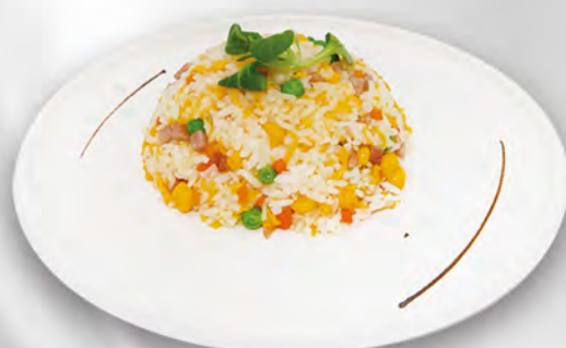
034 - RISO CANTONESE Riso saltato con prosciutto, piselli ed uovo Allergeni: 3