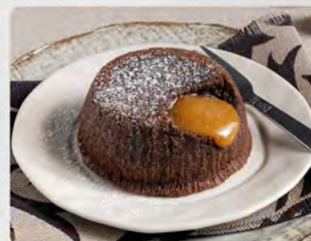
Souffle nocciola €4.00 Souffle con cuore alle nocciole piemontesi