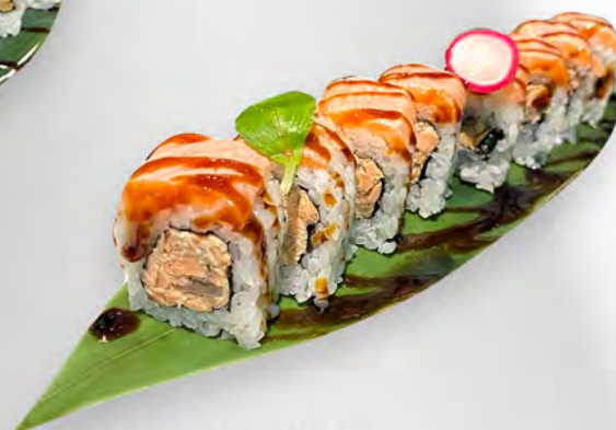
266 - MIURA ROLL Alghe, salmone cotto, philadelphia, sesamo, teriyaki Allergeni: 1, 4, 7, 11