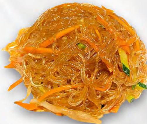
045 - SPAGHETTI DI SOIA VERDURE Spaghetti di soia con verdure mista Allergeni: 6