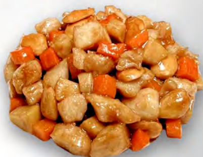
060 - POLLO CON MANDORLE Pollo saltato con le mandorle Allergeni: 8