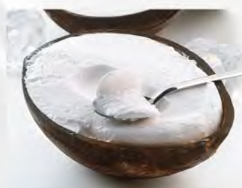
Cocco ripieno €5.00 Noce di cocco ripiena con gelato al cocco.