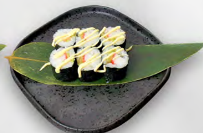
145 - HOSO CALIFORNIA Surimi di granchio, avocado e maionese Allergeni: 2, 3