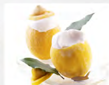
Limone ripieno €4.50 Frutto ripieno con sorbetto di limone.