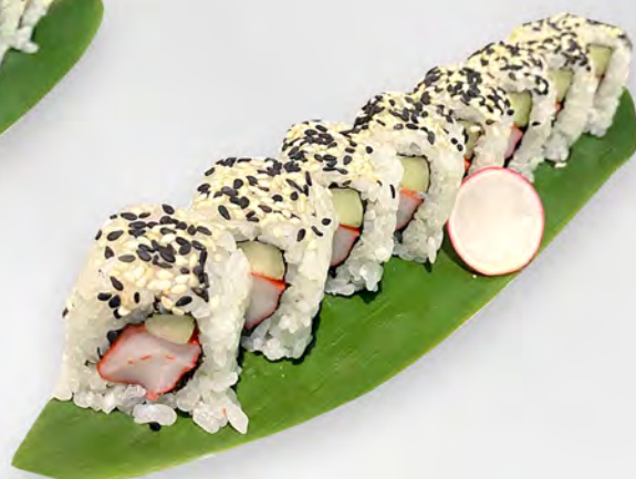
252 - URAMAKI CALIFORNIA Alghe, granchio, cetriolo, maionese, sesamo Allergeni: 2, 3, 11