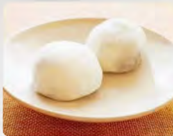
Mochi gelato vaniglia 3pz €4.50 Mochi gelato coco 3pz €4.50