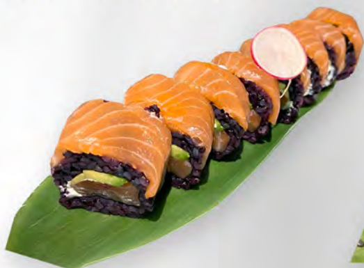
282 - URAMAKI BLACK SALMONE Alghe, riso venere, salmone, avocado, philadelphia, all'esterno salmone, teriyaki Allergeni: 1, 4, 7