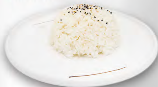
032 - RISO BIANCO