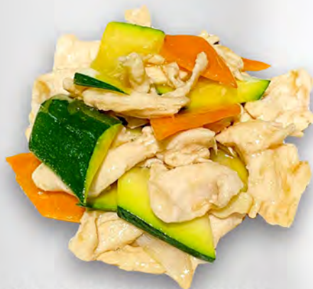
061 - POLLO CON VERDURE Pollo saltato con le verdure miste