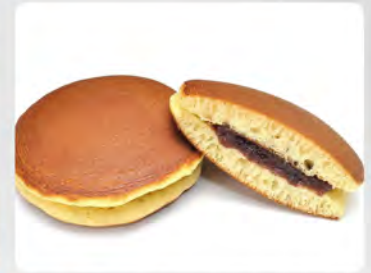
Dorayaki al cioccolato €4.00