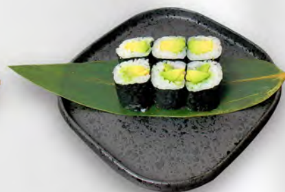
142 - HOSO AVOCADO Avocado