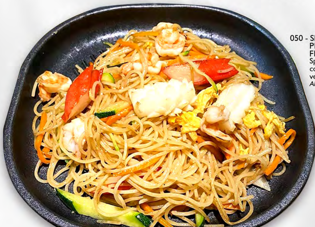
050 - SPAGHETTI ALLA PIASTRA CON FRUTTI DI MARE Spaghetti alla piastra con frutti di mare, verdure ed uova Allergeni: 1, 2, 3, 4, 14