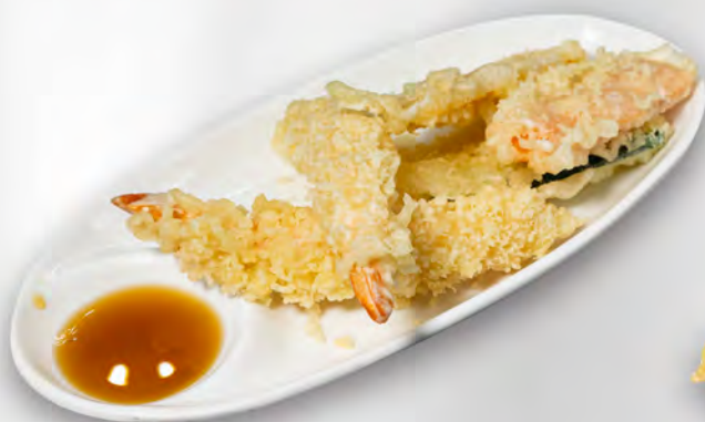
086 - TEMPURA MISTA Tempura di gamberi e verdure miste Allergeni: 1, 2 Massimo 1 porzione a persona