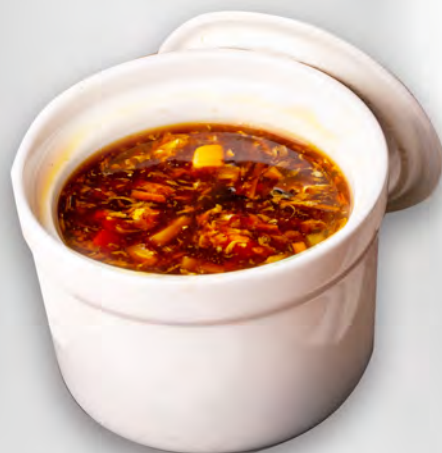
027 - ZUPPA AGROPICCANTE Bambù, funghi, tofu ed alghe e pollo Allergeni: 6