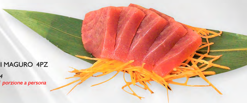
227 - SASHIMI MAGURO 4PZ Tonno Allergeni: 4 Massimo 1 porzione a persona