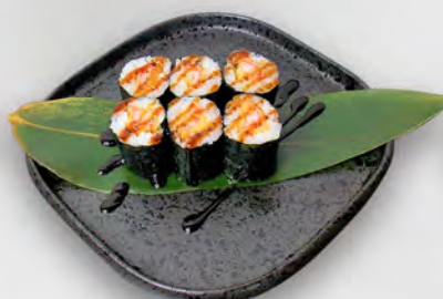
144 - HOSO EBI TEMPURA Tempura di gamberi con maionese e teriyaki Allergeni: 1, 2, 3