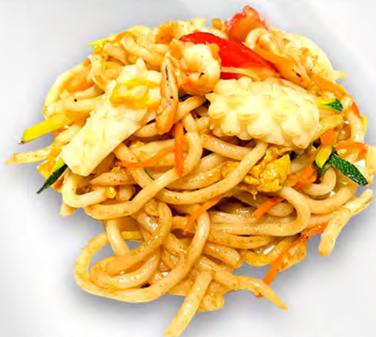
044 - YAKI UDON CON FRUTTI DI MARE Udon saltato con verdure, uova, frutti di mare mista Allergeni: 1, 2, 3, 4, 14