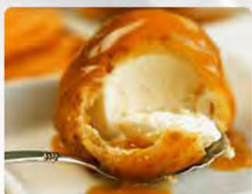
Gelato fritto vaniglia €4.00 Farina, gelato alla vaniglia. Gelato fritto nocciola €4.00 Farina, gelato alla nocciola.