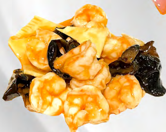
070 - GAMBERI CON FUNGHI E BAMBU Gamberi saltato con funghi e bambù Allergeni: 2