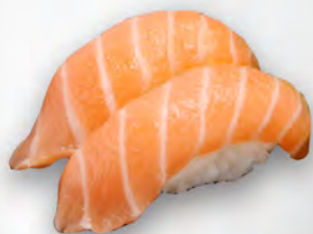
I20 - NIGIRI SAKE 2PZ Salmone Allergeni: 4