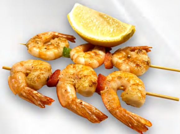
104 - SPIEDINI DI GAMBERI 2PZ Spiedini di gamberi con salsa teriyaki Allergeni: 2, 6