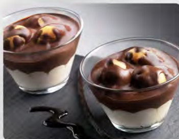
Coppa profiterole €4.00 Gelato semifreddo al cioccolato e bigné ripieni di crema al gusto vaniglia.