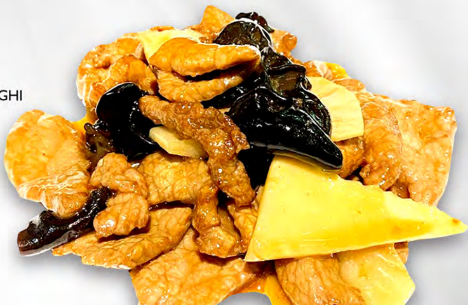
066 - MANZO CON FUNGHI E BAMBU Manzo saltato con funghi e bambù