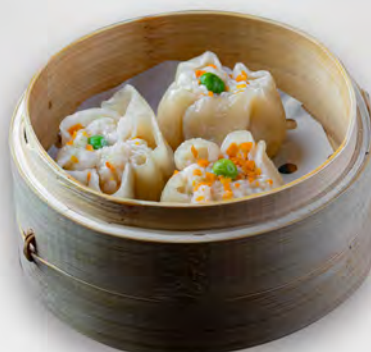
004 - SHAOMAI 3PZ Farina, carne e gamberi Allergeni: 1, 2