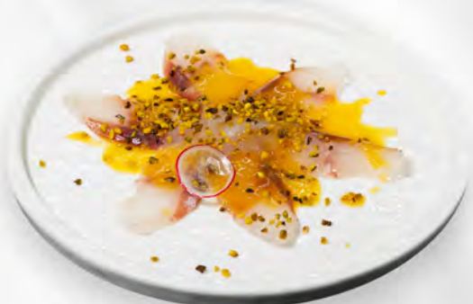
218 - CARPACCIO SUZUKI 4PZ Carpaccio di branzino con salsa ponzu e sesamo Allergeni: 4, 11 Massimo 3 porzione a persona