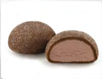
Mochi gelato cioccolato 3pz €4.50