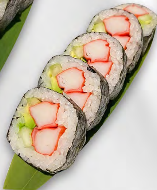
151 - FUTU CALIFORNIA Futo con surimi di granchio ed avocado Allergeni: 2