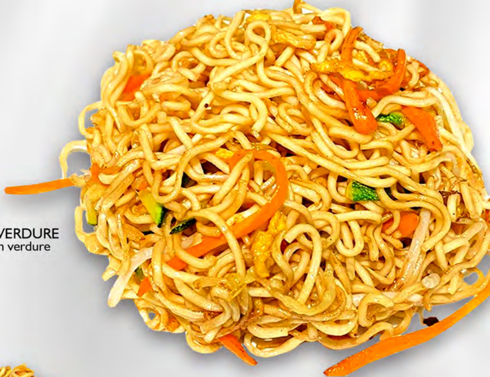
041 - RAMEN CON VERDURE Ramen saltato con verdure mista ed uova Allergeni: 1, 3