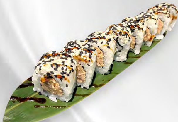
255 - URAMAKI MIURA Alghe, salmone cotto, philadelphia, sesamo, teriyaki Allergeni: 1, 4, 7, 11