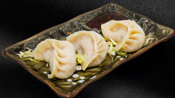
003 - RAVIOLI DI CARNE AL VAPORE 3PZ € 3.00 Farina, carne di maiale Allergeni: 1