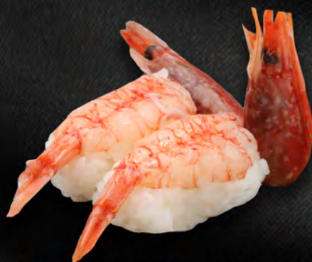
I24 - NIGIRI AMAEBI 2PZ € 4.00 Gamberi crudo Allergeni: 2