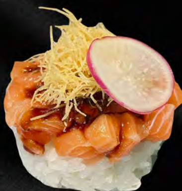
210 - TARTAR RISO SALMONE € 8.00 Riso con salmone, kataifi con salsa teriyaki Allergeni: 1, 4