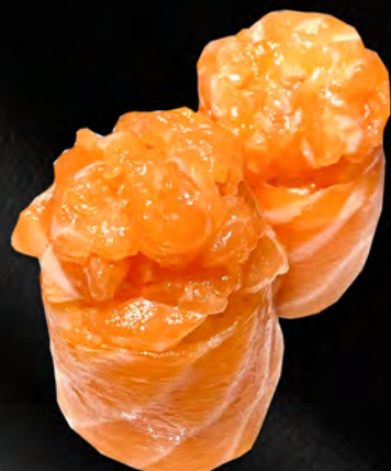
160 - BIGNE SALMONE € 5.00 Salmone Allergeni: 4