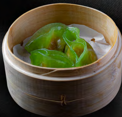
009 - RAVIOLI DI VERDURE 3PZ € 4.00 Farina e verdure miste Allergeni: 1