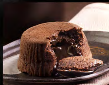
Souffle al cioccolato €4.00 Soufflé con cuore di cioccolato fuso.