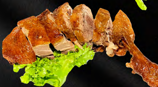
075 - ANATRA ARROSTO € 8.00