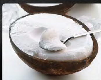
Cocco ripieno €5.00 Noce di cocco ripiena con gelato al cocco.