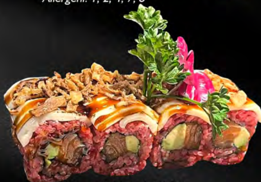
290 - TAIYO € 12.00 Riso rosso salmone avocado esterno formaggio flambé Allergeni: 4, 7