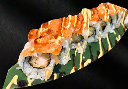
256 - URAMAKI SUMO € 8.00

Alghe, granchio, avocado, all'esterno salmone, teriyaki Allergeni: 1, 2, 4