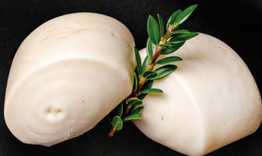
007 - PANE ORIENTALE 2PZ € 3.00 Pane soffice dolce al vapore Allergeni: 1, 7