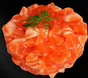
206 - TARTAR SALMONE € 8.00 Tartare di salmone con salsa ponzu e sesamo Allergeni: 4, 11