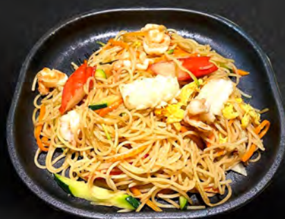
050 - SPAGHETTI ALLA PIASTRA CON FRUTTI DI MARE € 7.00 Spaghetti alla piastra con frutti di mare, verdure ed uova Allergeni: 1, 2, 3, 4, 14