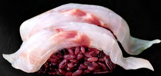
128 - NIGIRI SUZUKI BLACK 2PZ € 4.50 Branzino e riso venere Allergeni: 4