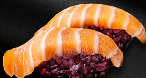
I26 - NIGIRI SAKÉ BLACK 2PZ € 4.50 Salmone e riso venere Allergeni: 4