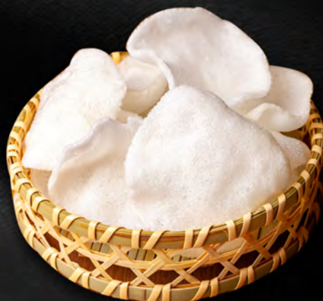
010 - NUVOLE DI GAMBERI € 2.50 Nuvole di gamberi fritti croccante Allergeni: 1, 2