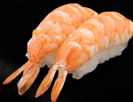
I23 - NIGIRI EBI 2PZ € 5.00 Gamberi cotto Allergeni: 2