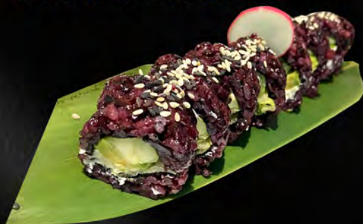
283 - URAMAKI BLACK VEGETARIANO € 10.00 Alghe, cetriolo, avocado, insalata, philadelphia, all'esterno sesamo Allergeni: 7, 11