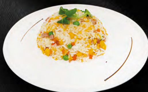
034 - RISO CANTONESE € 4.00 Riso saltato con prosciutto, piselli ed uovo Allergeni: 3