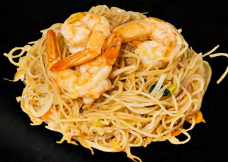
049 - SPAGHETTI DI RISO CON FRUTTI DI MARE € 6.00 Spaghetti di riso saltato con verdure, uova e frutti di mare Allergeni: 2, 3, 4, 14