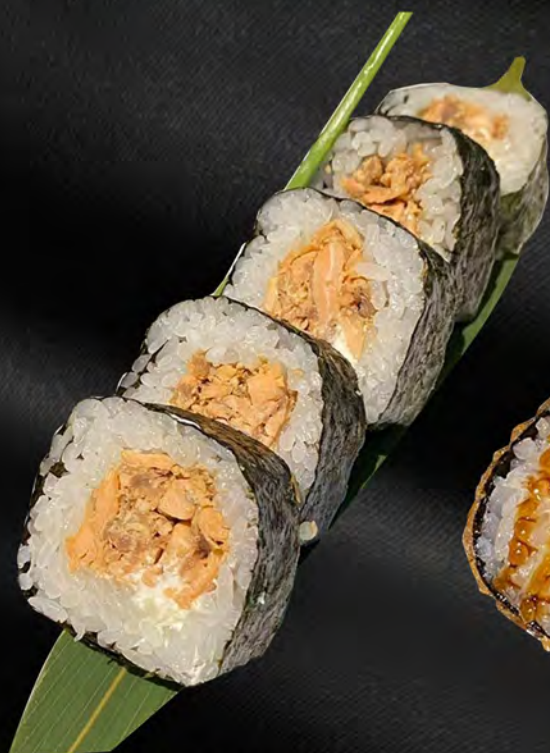
152 - FUTO MIURA € 8.00 Futo con salmone cotto e philadelphia Allergeni: 4, 7