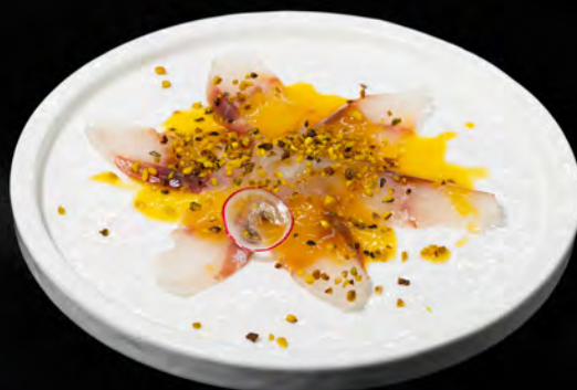
218 - CARPACCIO SUZUKI € 8.00 Carpaccio di branzino con salsa ponzu e sesamo Allergeni: 4, 11