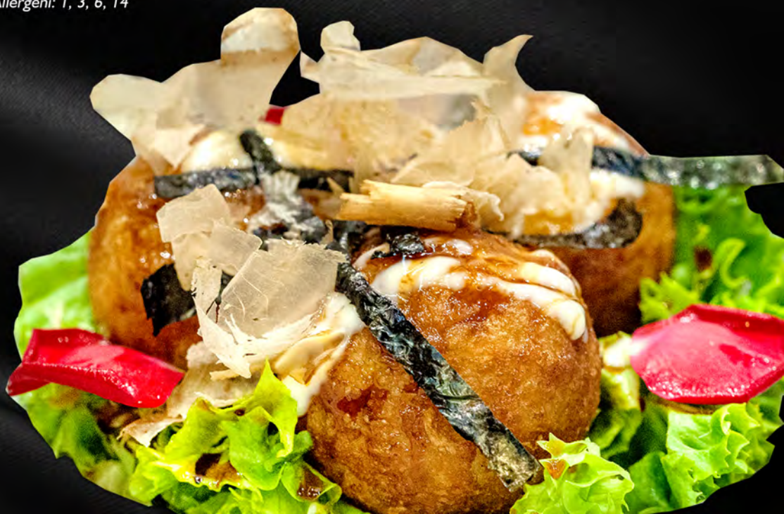
015 - TAKOYAKI 3PZ € 5.00 Polpette di polpo con salsa teriyaki e maionese Allergeni: 1, 3, 6, 14