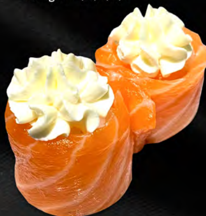
164 - BIGNE PHILADELPHIA € 5.00 Gunkan di salmone con philadelphia, kataifi Allergeni: 1, 4, 1