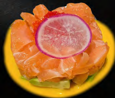
214 - TRIS TARTARE € 10.00 Tartare di salmone, avocado, mango, tobiko e salsa mango Allergeni: 4, 15