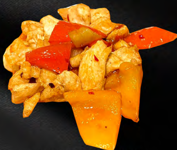
064 - POLLO PICCANTE € 6.00 Pollo saltato piccante con cipolla e peperoni