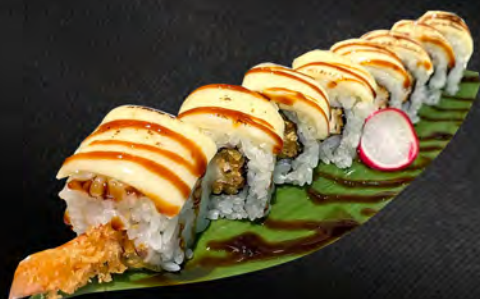
272 - CHEESE ROLL € 8.00 Alghe, tempura gamberi, all'esterno cheese scottato, teriyaki Allergeni: 1, 2, 7