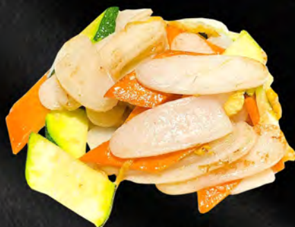
039 - GNOCCHI DI RISO CON VERDURE € 4.00 Gnocchi saltati con verdure mista