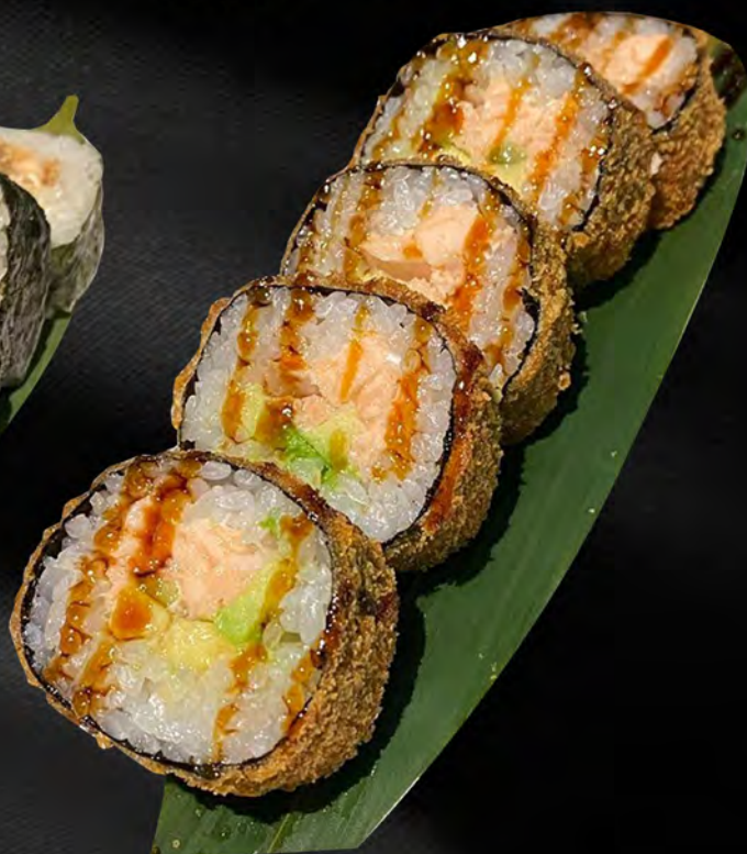
153 - FUTO FRITTO € 10.00 Futo fritto con salmone, avocado, philadelphia e salsa teriyaki Allergeni: 1, 4, 7