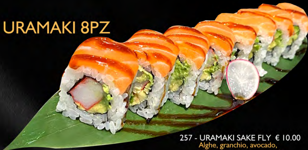
257 - URAMAKI SAKE FLY € 10.00

Alghe, granchio, avocado, all'esterno salmone, teriyaki Allergeni: 1, 2, 4