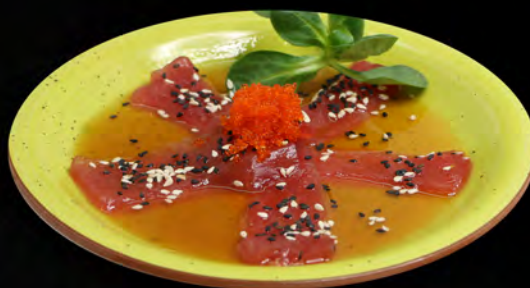
216 - CARPACCIO MAGURO € 9.00 Carpaccio di tonno con salsa ponzu e sesamo Allergeni: 4, 11