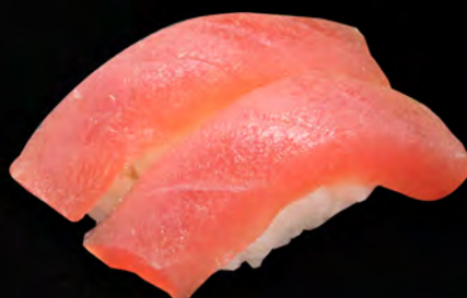
I21 - NIGIRI MAGURO 2PZ € 4.00 Tonno Allergeni: 4