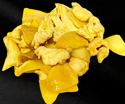
062 - POLLO AL CURRY € 6.00 Pollo saltato con le verdure miste al curry