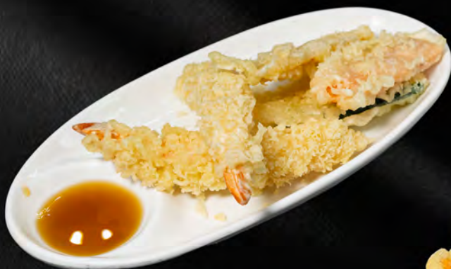
086 - TEMPURA MISTA € 10.00 Tempura di gamberi e verdure miste Allergeni: 1, 2