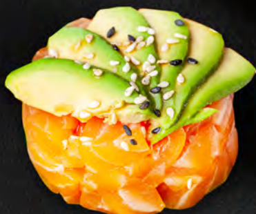
209 - TARTAR BLOOM € 10.00 Tartare di salmone, avocado, philadelphia e salsa teriyaki Allergeni: 1, 4, 7