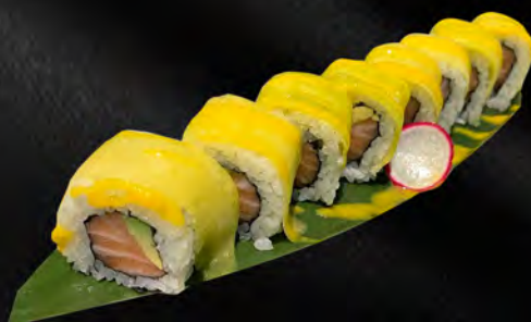
269 - MANGO ROLL € 10.00 Alghe, salmone, avocado, all'esterno mango, salsa di mango con passione Allergeni: 1, 4