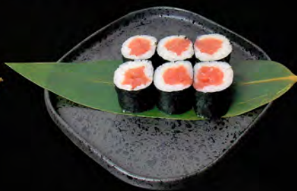
141 - HOSO MAGURO