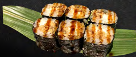
146 - HOSO MIURA