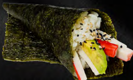
182 - TEMAKI CALIFORNIA € 4.00 Cono di riso con surimi, avocado e maionese Allergeni: 2, 3