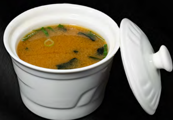
026 - ZUPPA MISO € 4.00 Tofu, alghe Allergeni: 6