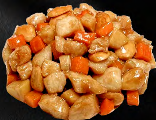
060 - POLLO CON MANDORLE € 6.00 Pollo saltato con le mandorle Allergeni: 8