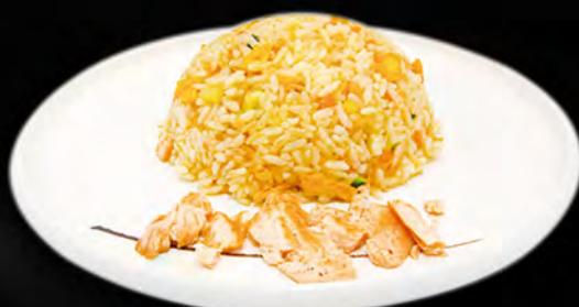
035 - RISO SALMONE € 6.00 Riso saltato con salmone, piselli ed uovo Allergeni: 3, 4