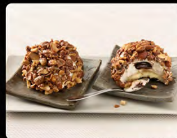
Crocante alle mandorle €4.50 Dessert semifreddo con crema alla nocciola, cuore morbido al cioccolato, decorato con mandorle caramellate.