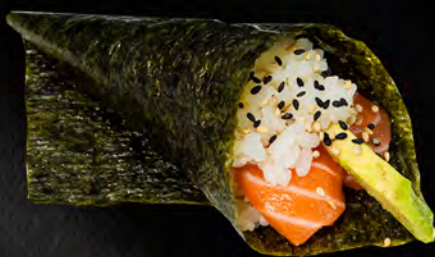
180 - TEMAKI SAKE € 4.00 Cono di riso con salmone ed avocado Allergeni: 4