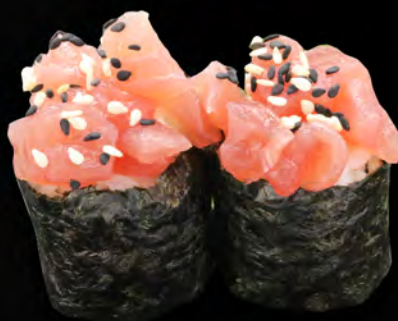
167 - GUNKAN TONNO € 5.00 Tonno con alghe e salsa maionese piccante Allergeni: 3, 4