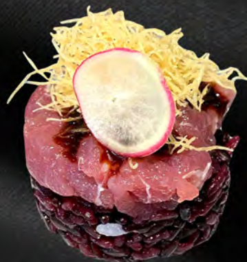
213 - TARTAR RISO BLACK TUNA € 9.00 Riso venere, tonno, kataifi con salsa teriyaki, philadelphia Allergeni: 1, 4, 7