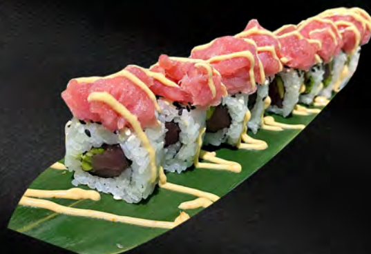
260 - URAMAKI SPICY TONNO € 10.00

Alghe, salmone, avocado, sesamo, all'esterno tartare salmone spicy Allergeni: 4, 11