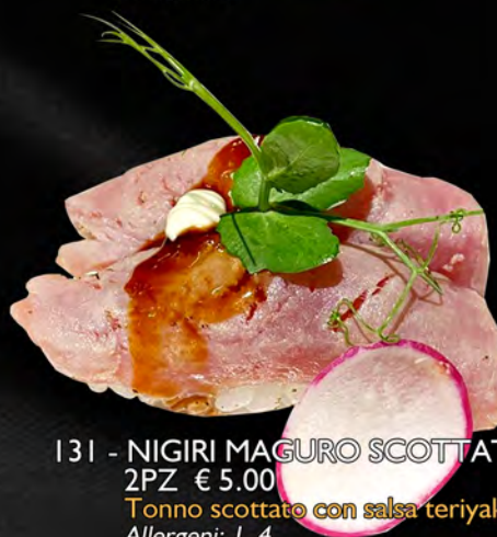
131 - NIGIRI MAGURO SCOTTATO 2PZ € 5.00 Tonno scottato con salsa teriyaki Allergeni: 1, 4