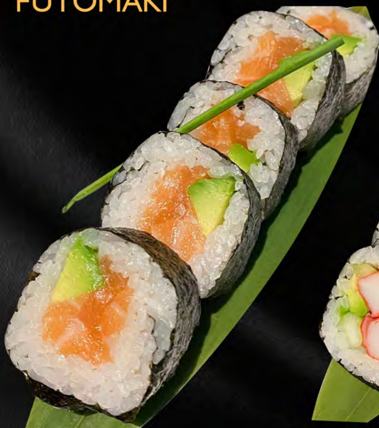
150 - FUTO SAKE € 8.00 Futo con salmone ed avocado Allergeni: 4