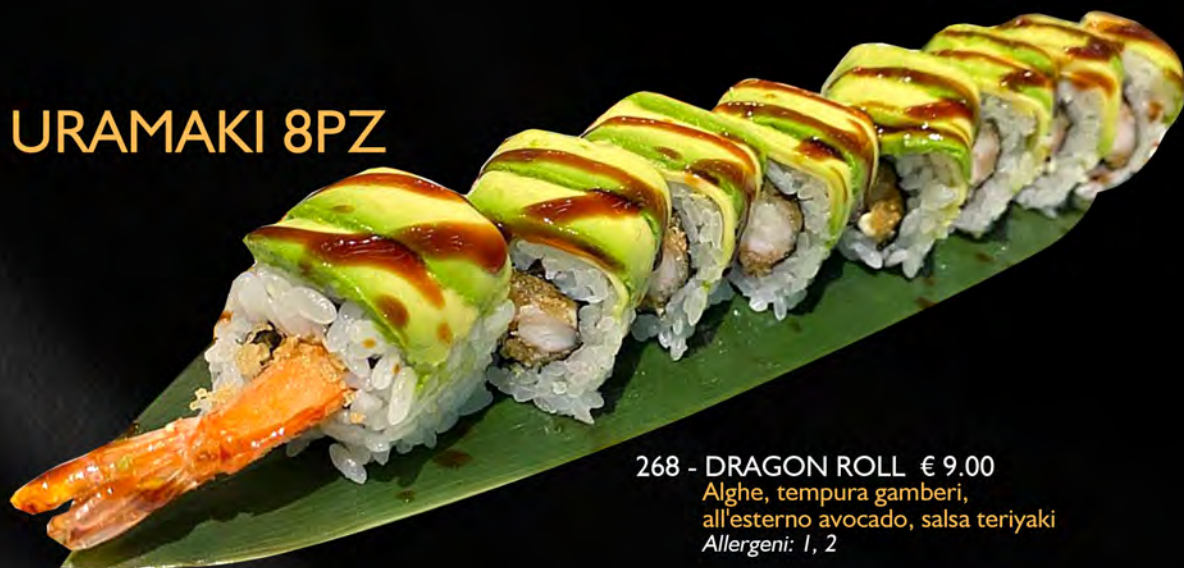
268 - DRAGON ROLL € 9.00 Alghe, tempura gamberi, all'esterno avocado, salsa teriyaki Allergeni: 1, 2