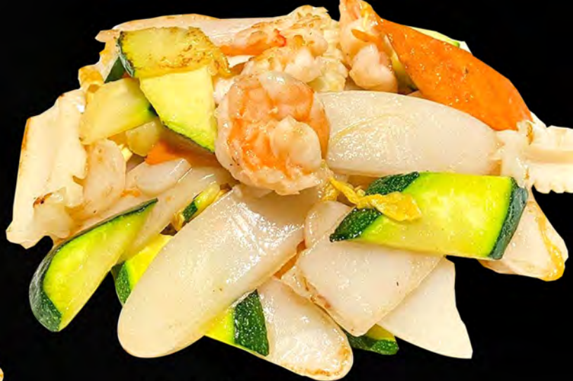
040 - GNOCCHI CON FRUTTI DI MARE € 5.00 Gnocchi di riso saltato con verdure, frutti di mare mista Allergeni: 2, 4, 14