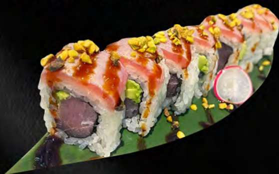
262 - URAMAKI PISTACCHIO € 11.00 Alghe, avocado, tonno, all'esterno tonno scottato, pistacchio, teriyaki Allergeni: 1, 4, 8