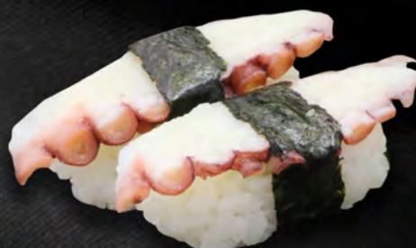
I25 - NIGIRI TAKO 2PZ € 4.00 Polpo Allergeni: 4