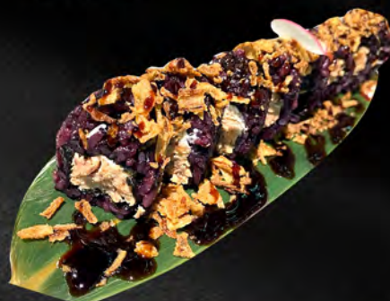
280 - URAMAKI BLACK MIURA € 10.00 Alghe, riso venere, salmone cotto, philadelphia, all'esterno cipolla fritto, teriyaki Allergeni: 1, 4, 7