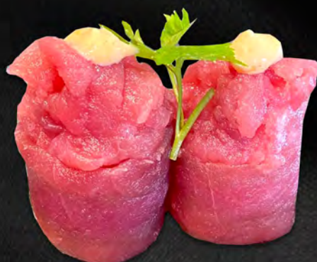
161 - BIGNE TONNO € 6.00 Tonno Allergeni: 4