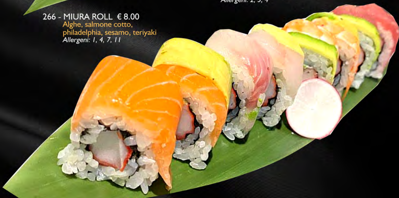
267 - RAINBOW ROLL € 12.00 Alghe, avocado, granchio, maionese, all'esterno pesce misti Allergeni: 2, 3, 4