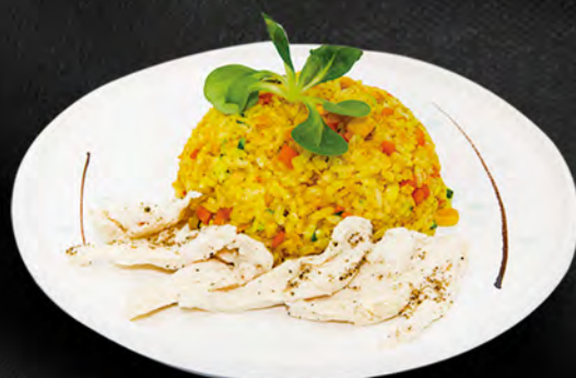
036 - RISO CURRY € 8.00 Riso al curry con pollo, verdure mista