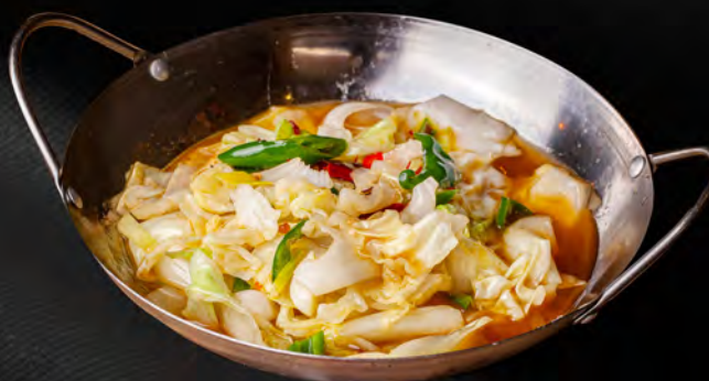
079 - SCODELLA DI FUOCO CON VERDURE € 7.00 Verdure miste