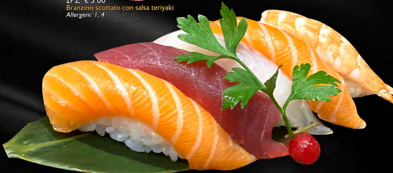
133 - NIGIRI MISTO € 9.00 6 pezzi nigiri misto Allergeni: 2, 4