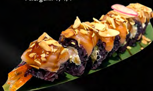
286 - BLACK EBI MANDORLE ROLL € 12.00 Alghe, tempura gamberi, philadelphia, all'esterno salmone, mandorle, teriyaki Allergeni: 1, 2, 4, 7, 8