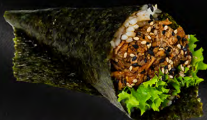
186 - TEMAKI MIURA € 4.00 Cono di riso con salmone cotto e philadelphia Allergeni: 4, 7