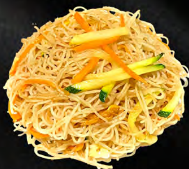
048 - SPAGHETTI DI RISO CON VERDURE € 4.00 Spaghetti di riso saltato con verdure miste, uova Allergeni: 3