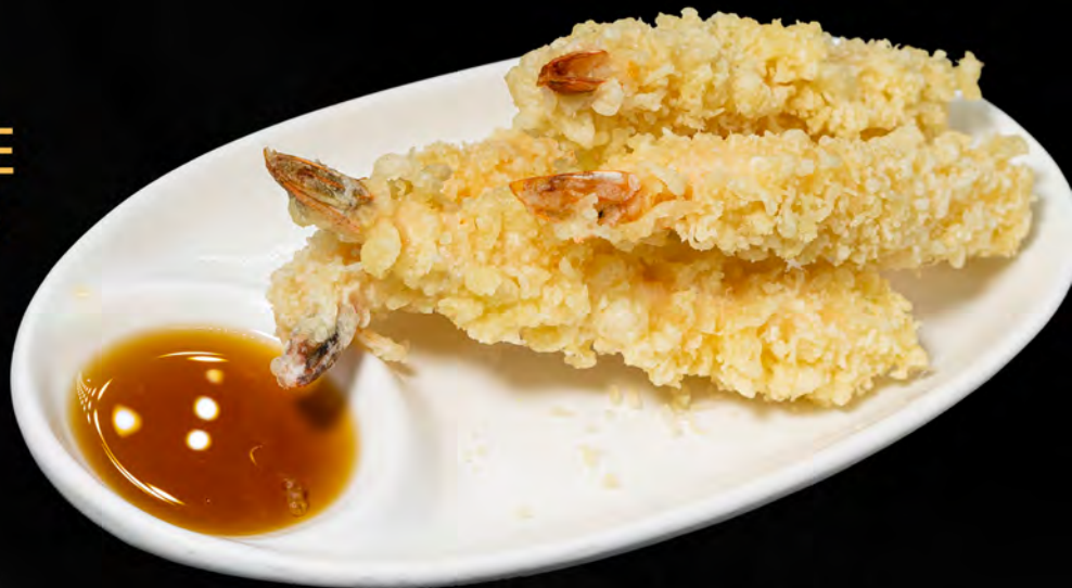
087 - EBI TEMPURA 3PZ € 7.00 Tempura di gamberi Allergeni: 1, 2