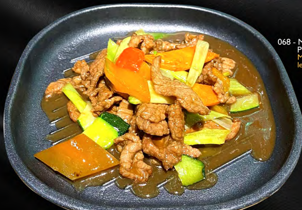
068 - MANZO ALLA PIASTRA € 8.00 Manzo alla piastra con le verdure miste