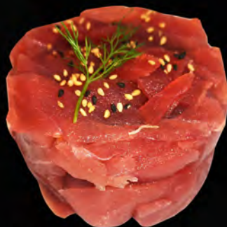
207 - TARTAR TUNA € 9.00 Tartare di tonno con salsa ponzu e sesamo Allergeni: 4, 11