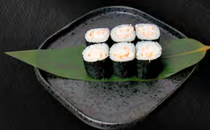
143 - HOSO EBI