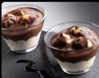
Coppa profiterole €4.00 Gelato semifreddo al cioccolato e bigné ripieni di crema al gusto vaniglia.