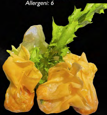
014 - SACCHETTI DI GAMBERI 3PZ € 3.00 Farina, carne e gamberi Allergeni: 1, 2