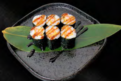
144 - HOSO EBI TEMPURA