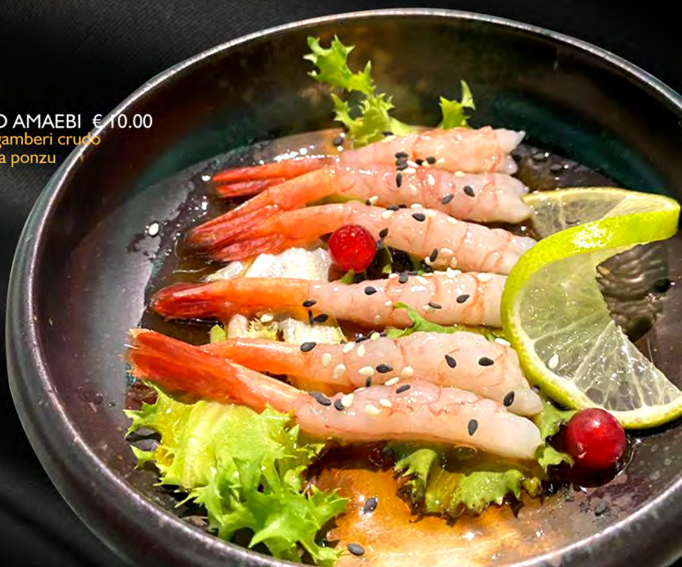
219 - CARPACCIO AMAEBI € 10.00 Carpaccio di gamberi crudo dolce con salsa ponzu Allergeni: 2