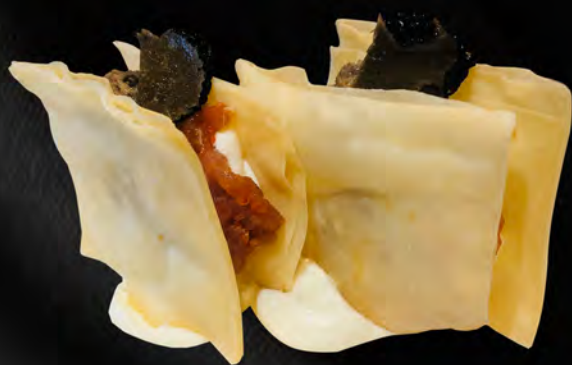
244 - MILLE TONNO € 6.00 Millefoglie croccante con di tonno, philadelphia, tobiko e salsa teriyaki Allergeni: 1, 4, 7, 15