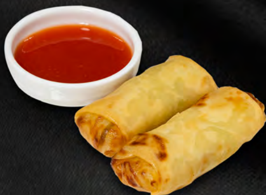
001 - INVOLTINI PRIMAVERA 2PZ € 2.50 Verdure mista Allergeni: 1