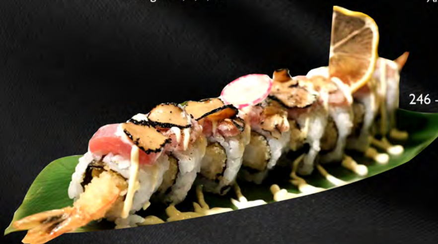
246 - TARTUFO ROLL € 15.00 Tempura di gamberi, avocado, tonno scottato, all'esterno con salsa tartufo e teriyaki Allergeni: 1, 2, 4