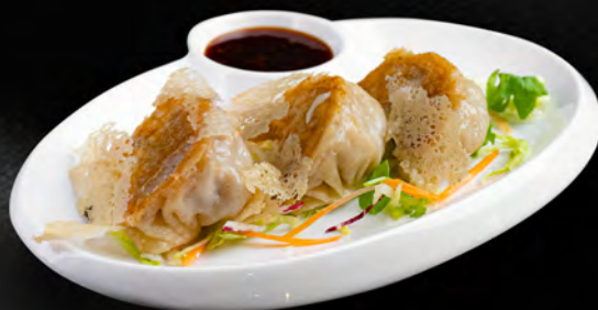
005 - RAVIOLI ALLA GRIGLIA 3PZ € 3.50 Farina, carne di maiale Allergeni: 1