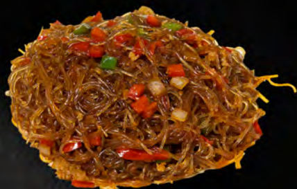
046 - SPAGHETTI DI SOIA PICCANTE € 5.00 Spaghetti di soia con carne di suino, salsa piccante, cipolle e peperoni Allergeni: 6