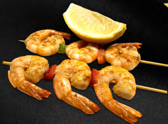
104 - SPIEDINI DI GAMBERI 2PZ € 5.00 Spiedini di gamberi con salsa teriyaki Allergeni: 2, 6