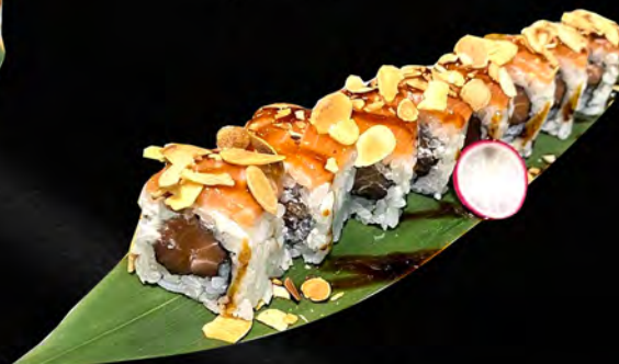
258 - STAR ROLL € 11.00

Alghe, gamberi in tempura, riso soffiato, salmone piccante, teriyaki Allergeni: 1, 2, 4