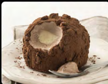
Tartufo classico €4.50 Gelato semifreddo allo zabaione e gelato al cioccolato, decorato con granella di nocciole e cacao.