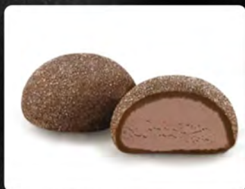
Mochi gelato cioccolato 3pz €4.50