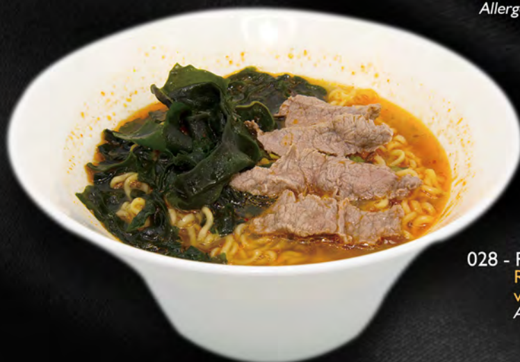
028 - RAMEN CON MANZO € 8.00 Ramen in brodo con manzo e verdure miste Allergeni: 1