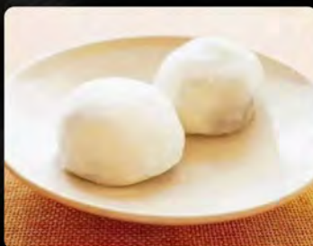
Mochi gelato vaniglia 3pz €4.50 Mochi gelato coco 3pz €4.50