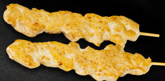
105 - SPIEDINI DI POLLO 2PZ € 4.00 Spiedini di pollo