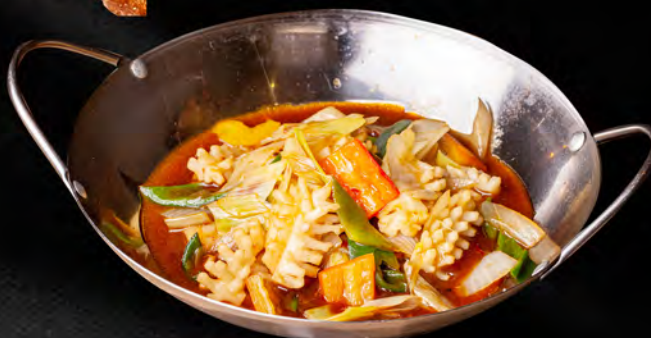
077 - SCODELLA DI FUOCO CON FRUTTI DI MARE PICCANTE € 8.00 Gamberi, calamari, verdure miste, surimi di granchio e salsa piccante Allergeni: 2, 4, 14