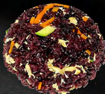
051 - RISO BLACK CON VERDURE € 5.00 Riso venere saltato con verdure miste ed uova Allergeni: 3