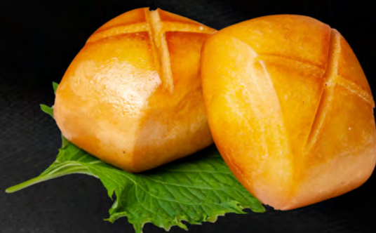
008 - PANE FRITTO 2PZ € 3.00 Allergeni: 1, 7