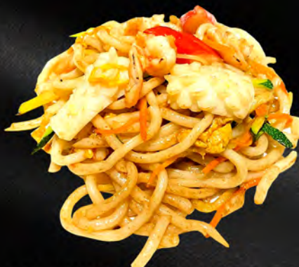
044 - YAKI UDON CON FRUTTI DI MARE € 7.00 Udon saltato con verdure, uova, frutti di mare mista Allergeni: 1, 2, 3, 4, 14