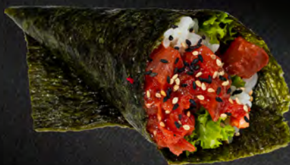
184 - TEMAKI SPICY TUNA € 5.00 Cono di riso con avocado, tonno e maionese piccante Allergeni: 3, 4