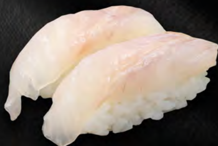
I22 - NIGIRI SUZUKI 2PZ € 4.00 Branzino Allergeni: 4