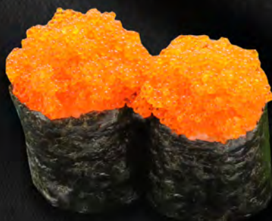
168 - GUNKAN TOBIKO € 5.00 Gunkan con uova di pesce volante Allergeni: 15