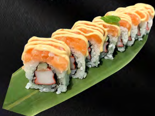
264 - TARTARE ROLL € 11.00 Alghe, granchio, cetriolo, all'esterno tartare salmone spicy Allergeni: 1, 2, 4