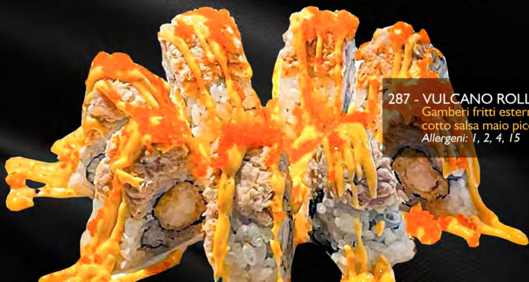
287 - VULCANO ROLL € 11.00 Gamberi fritti esterno tonno cotto salsa maio piccante etibico Allergeni: 1, 2, 4, 15