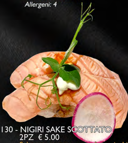
130 - NIGIRI SAKE SCOTTATO 2PZ € 5.00 Salmone scottato con salsa teriyaki Allergeni: 1, 4