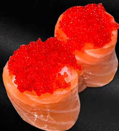
162 - BIGNE TOBIKO € 5.00 Salmone con uova di pesce volante Allergeni: 4, 15