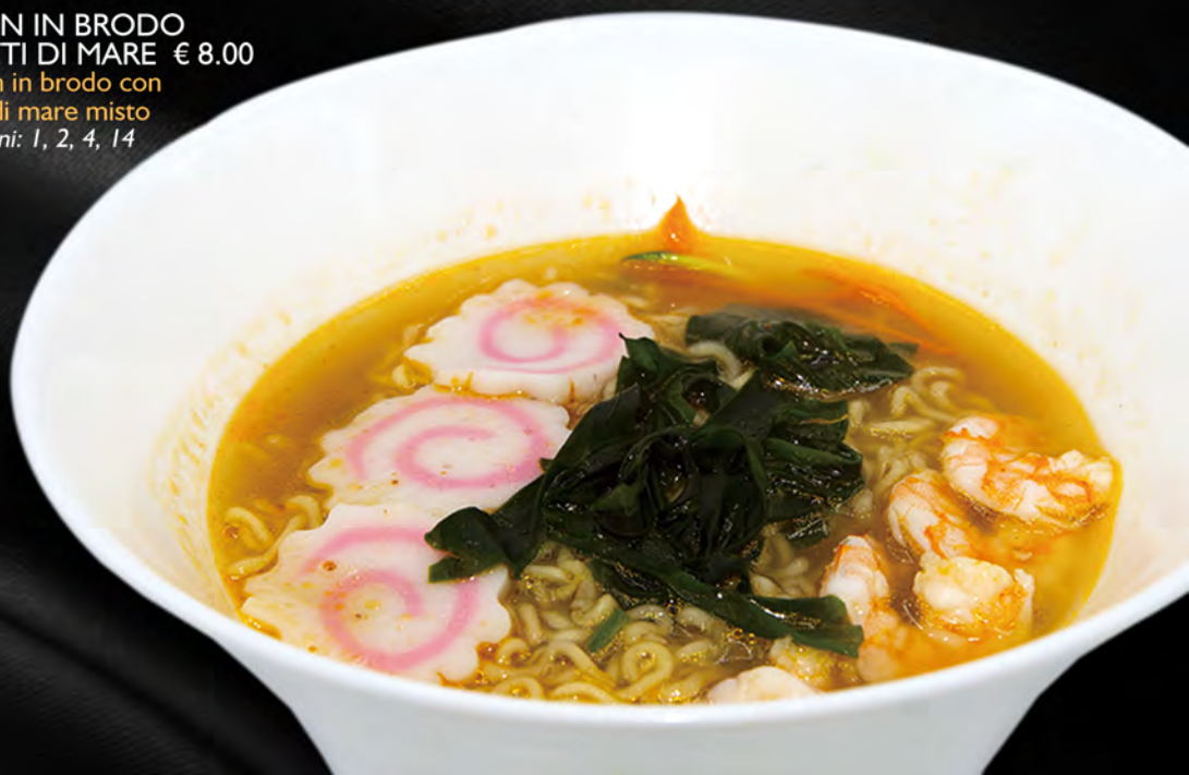
029 - RAMEN IN BRODO FRUTTI DI MARE € 8.00 Ramen in brodo con frutti di mare misto Allergeni: 1, 2, 4, 14