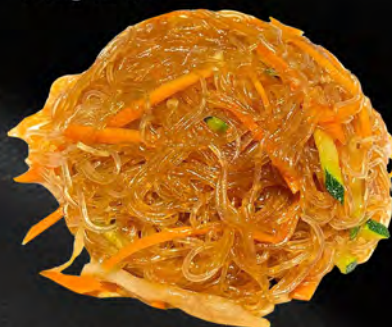
045 - SPAGHETTI DI SOIA VERDURE € 4.00 Spaghetti di soia con verdure mista Allergeni: 6