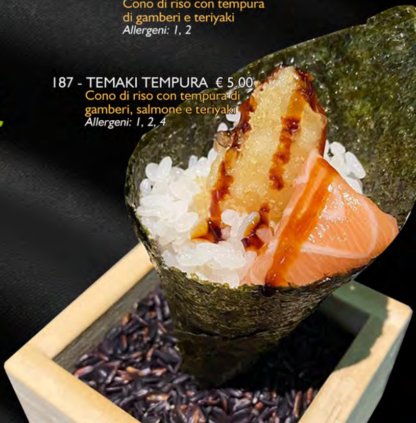
187 - TEMAKI TEMPURA € 5.00 Cono di riso con tempura di gamberi, salmone e teriyaki Allergeni: 1, 2, 4