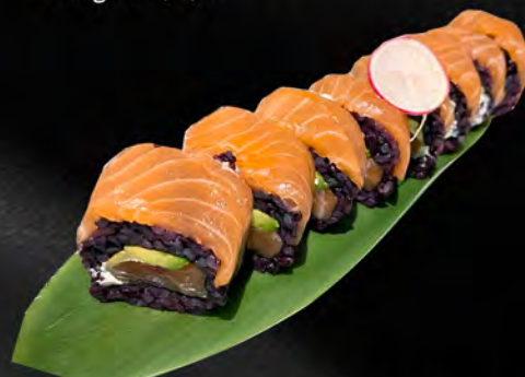
282 - URAMAKI BLACK SALMONE € 12.00 Alghe, riso venere, salmone, avocado, philadelphia, all'esterno salmone, teriyaki Allergeni: 1, 4, 7