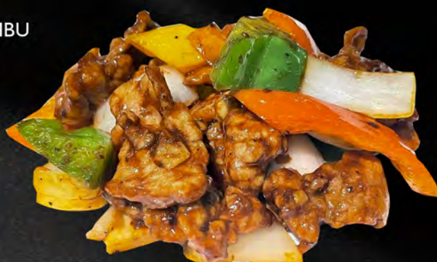
067 - MANZO PEPE NERO € 7.00 Manzo saltato con cipolla, peperoni e pepe nero