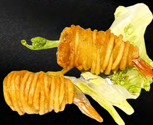
091 - YOSHIEBI 2PZ € 5.00 Patate gamberi fritti Allergeni: 1, 2