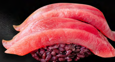
I27 - NIGIRI MAGURO BLACK 2PZ € 4.50 Tonno e riso venere Allergeni: 4