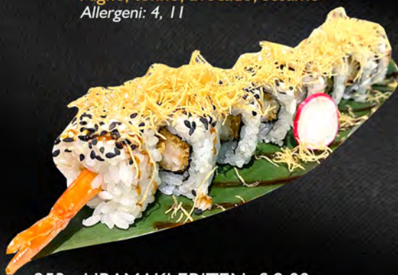
253 - URAMAKI EBITEN € 9.00 Alghe, gamberi in tempura, teriyaki, kataifi, sesamo Allergeni: 1, 2, 11