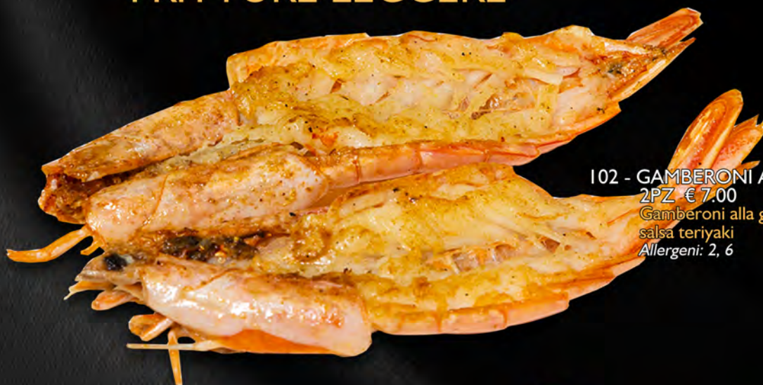
102 - GAMBERONI ALLA GRIGLIA 2PZ € 7.00 Gamberoni alla griglia con salsa teriyaki Allergeni: 2, 6