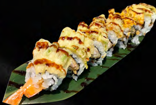
270 - URAMAKI FIORI DI ZUCCA € 10.00 Alghe, tempura gamberi, all'esterno fior di zucca, teriyaki Allergeni: 1, 2