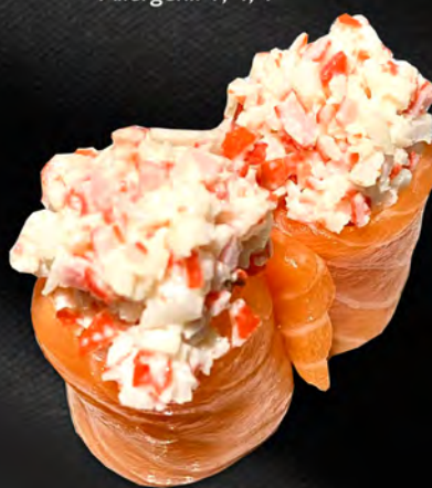
165 - BIGNE KANI € 5.00 Gunkan con salmone, tartare di granchio, maionese piccante. Allergeni: 2, 3, 4