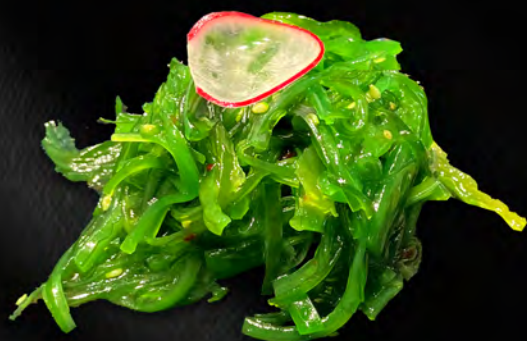
011 - GOMA WAKAME € 5.00 Alghe marinate dolci con i semi di sesamo Allergeni: 11