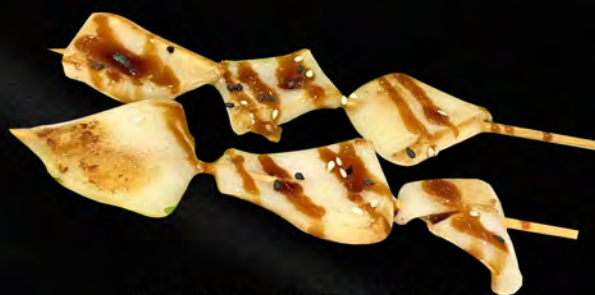
103 - IKA TEPPAN 2PZ € 5.00 Spiedini di calamari Allergeni: 14