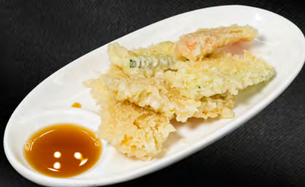
088 - YASAI TEMPURA € 8.00 Tempura di verdure miste Allergeni: 1