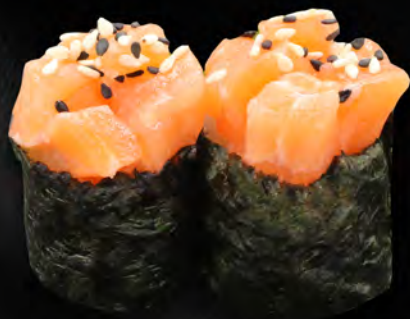
166 - GUNKAN SALMONE € 5.00 Salmone con alghe e salsa maionese piccante Allergeni: 3, 4