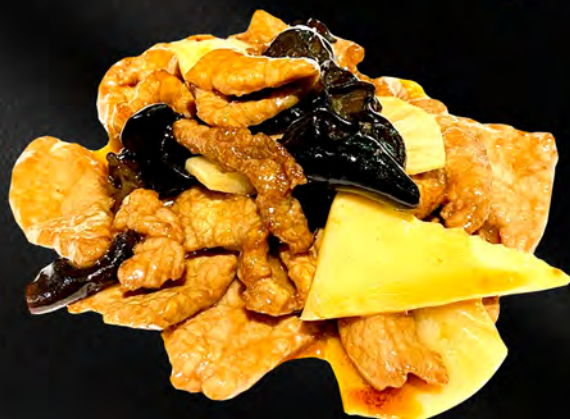
066 - MANZO CON FUNGHI E BAMBU € 7.00 Manzo saltato con funghi e bambù