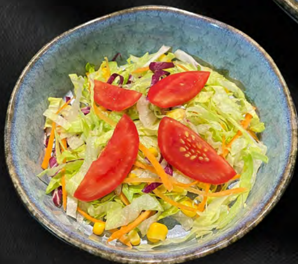
020 - INSALATA MISTA € 4.00