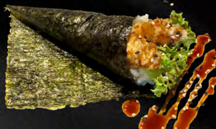
185 - TEMAKI EBITEN € 4.00 Cono di riso con tempura di gamberi e teriyaki Allergeni: 1, 2