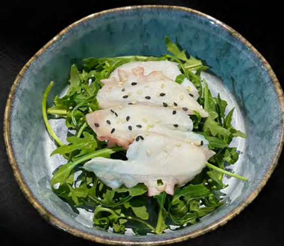
023 - INSALATA POLPO € 6.00 Rucola e polpo Allergeni: 14