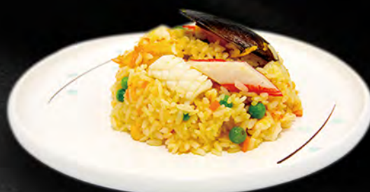
037 - RISO FRUTTI DI MARE € 6.50 Riso saltato con verdure, uova, frutti di mare mista Allergeni: 2, 3, 4, 14