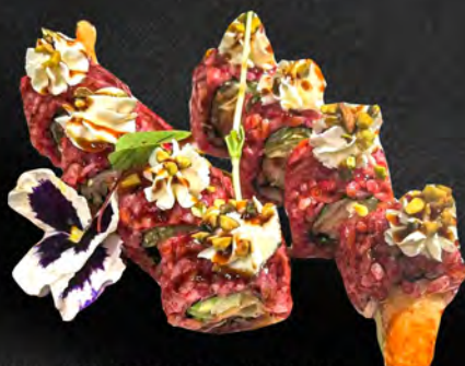
289 - MING ROLL € 11.00 Riso rosso tempura di gamberi philadelphia, insalata teriyaki, pistacchi Allergeni: 1, 2, 7, 8