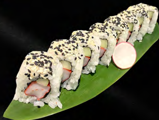
252 - URAMAKI CALIFORNIA € 8.00 Alghe, granchio, cetriolo, maionese, sesamo Allergeni: 2, 3, 11