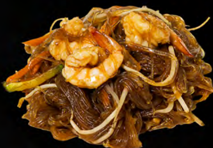
047 - SPAGHETTI DI SOIA CON FRUTTI DI MARE € 6.00 Spaghetti di soia con verdure e frutti di mare mista Allergeni: 2, 4, 6, 14