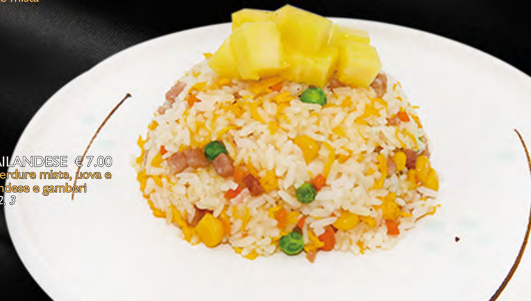
038 - RISO TAILANDESE € 7.00 Ananas, verdure miste, uova e salsa thailandese e gamberi Allergeni: 2, 3