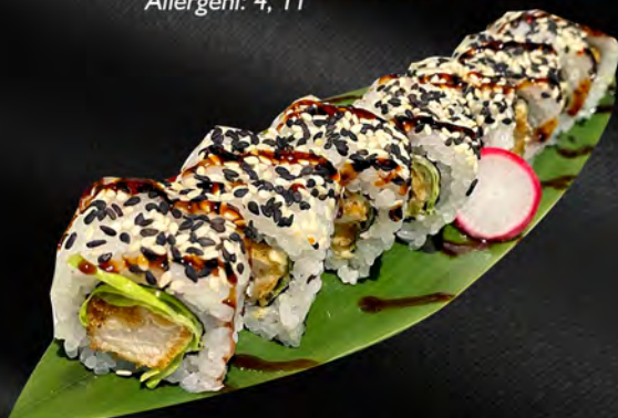
261 - CHICHEN ROLL € 10.00

Alghe, tonno crudo, avocado, sesamo, all'esterno tartare tonno spicy Allergeni: 4, 11