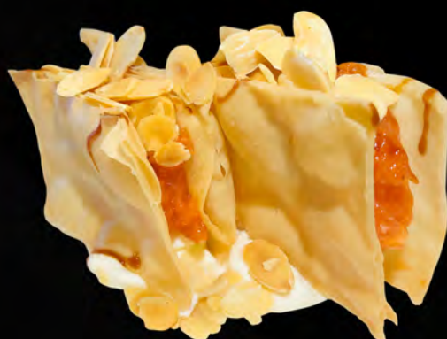
245 - MILLE SAKE € 6.00 Millefoglie croccante con salmone, philadelphia, tobiko e salsa teriyaki Allergeni: 1, 4, 7, 15