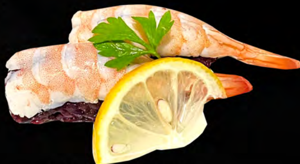
129 - NIGIRI EBI BLACK 2PZ € 4.50 Gamberi e riso venere Allergeni: 2