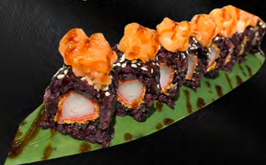
285 - FUTOMAKI CALIFORNIA RISO VENERE € 12.00 Riso venere, alghe, esterno tartare salmone, granchio fritto, teriyaki, sesamo Allergeni: 1, 2, 4, 11