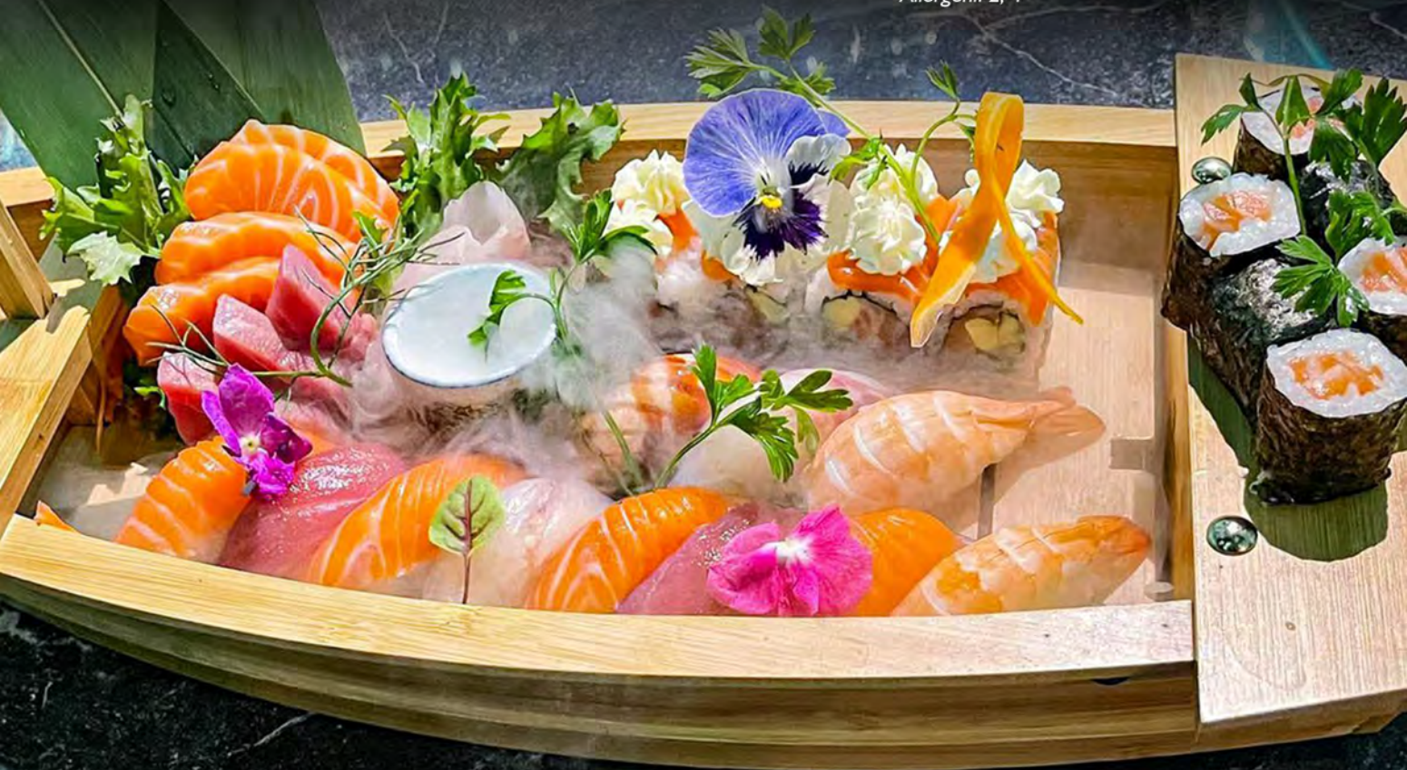
311 - BARCA 35PZ € 30.00 Salmone roll 8pz, Hosa sake 6pz, Nigiri misto 11pz, Sashimi misto 10pz Allergeni: 2, 4