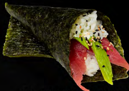
181 - TEMAKI MAGURO € 5.00 Cono di riso con tonno ed avocado Allergeni: 4