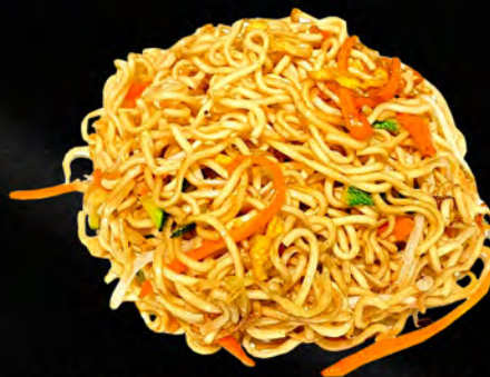
041 - RAMEN CON VERDURE € 5.00 Ramen saltato con verdure mista ed uova Allergeni: 1, 3