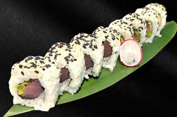
251 - URAMAKI MAGURO € 9.00 Alghe, tonno, avocado, sesamo Allergeni: 4, 11