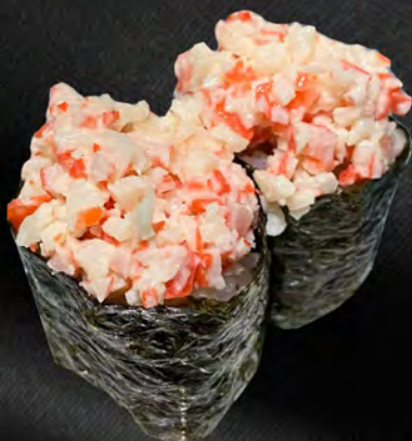
170 - GUNKAN KANI € 4.00 Tartare di granchio e maionese piccante Allergeni: 2, 3