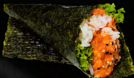
183 - TEMAKI SPICY SALMONE € 4.00 Cono di riso con avocado, salmone e maionese piccante Allergeni: 4