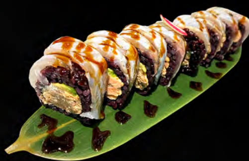
284 - URAMAKI BLACK PENICE € 12.00 Alghe, riso venere, salmone cotto, avocado, philadelphia, all'esterno branzino scottato, teriyaki Allergeni: 1, 4, 7