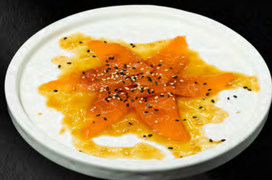
215 - CARPACCIO SAKE € 8.00 Carpaccio di salmone con salsa ponzu e sesamo Allergeni: 4, 11