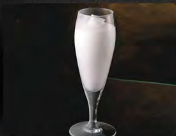
Sorbetto al limone €3.50 Gelato al limone, limoncello, latte.