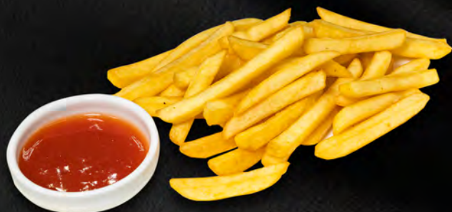
013 - PATATINE FRITTE € 3.00 Allergeni: 1