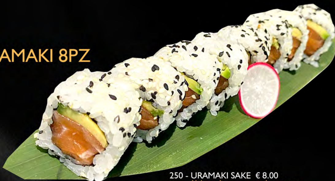
250 - URAMAKI SAKE € 8.00 Alghe, salmone, avocado, sesamo Allergeni: 4, 11