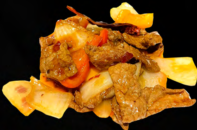
065 - MANZO PICCANTE € 7.00 Manzo piccante con cipolla e peperoni