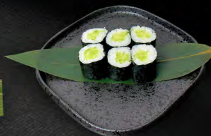
148 - HOSO KYUKI