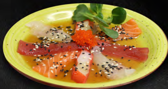
217 - CARPACCIO MISTO € 10.00 Salmone, tonno, branzino con salsa ponzu e sesamo Allergeni: 4, 11