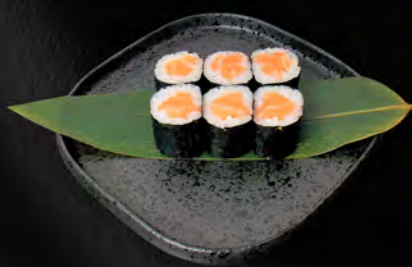
140 - HOSO SAKE