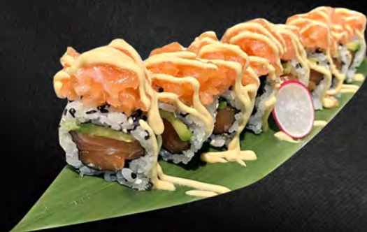
259 - URAMAKI SPICY SALMONE € 9.00

Alghe, philadelphia, salmone, all'esterno salmone, mandorle, teriyaki Allergeni: 1, 4, 7, 8