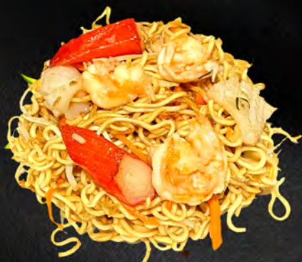
042 - RAMEN SALTATO CON FRUTTI DI MARE € 6.00 Ramen saltato con frutti di mare mista, verdura ed uova Allergeni: 1, 2, 3, 4, 14