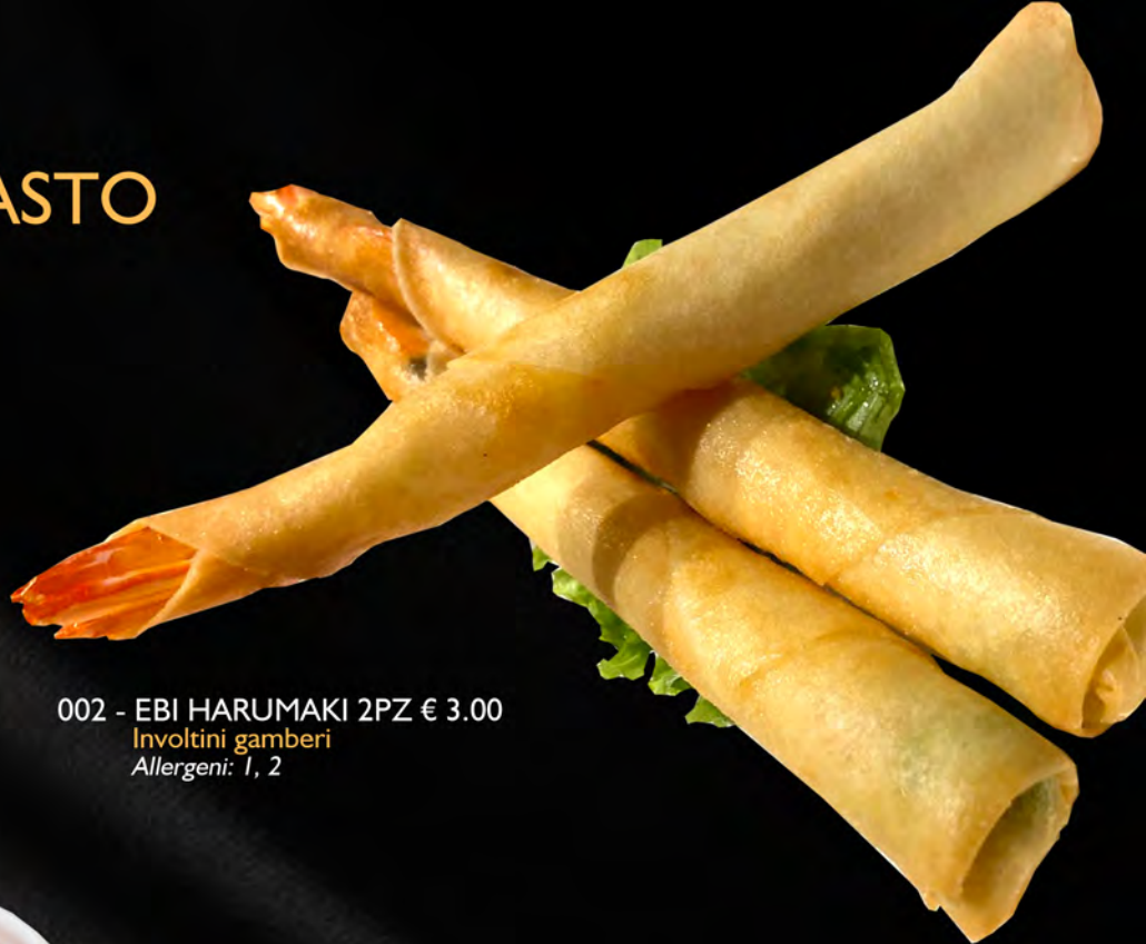
002 - EBI HARUMAKI 2PZ € 3.00 Involtini gamberi Allergeni: 1, 2