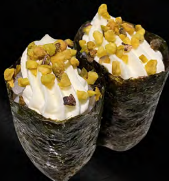
169 - GUNKAN PHILADELPHIA € 4.00 Philadelphia, alghe e pistacchio Allergeni: 7, 8