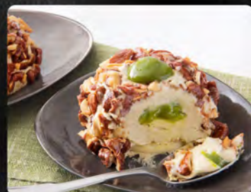
Crocante al pistacchio €4.50 Dessert semifreddo con crema al pistacchio con cuore al pistacchio, decorato con granella di mandorle caramellate.