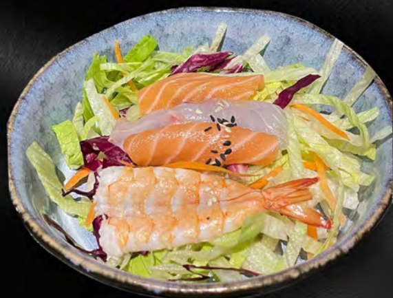
022 - INSALATA FRUTTI DI MARE MISTA € 5.00 Insalata mista con gamberi cotto, polpo e salmone crudo Allergeni: 2, 4, 14