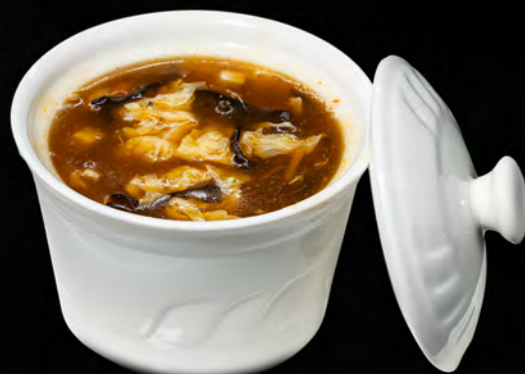
027 - ZUPPA AGROPICCANTE € 4.00 Bambù, funghi, tofu ed alghe e pollo Allergeni: 6