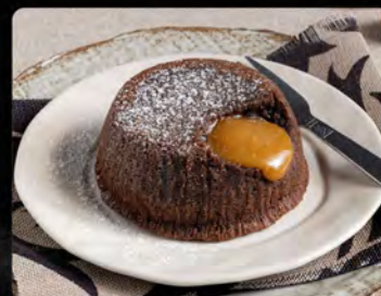
Souffle nocciola €4.00 Souffle con cuore alle nocciole piemontesi