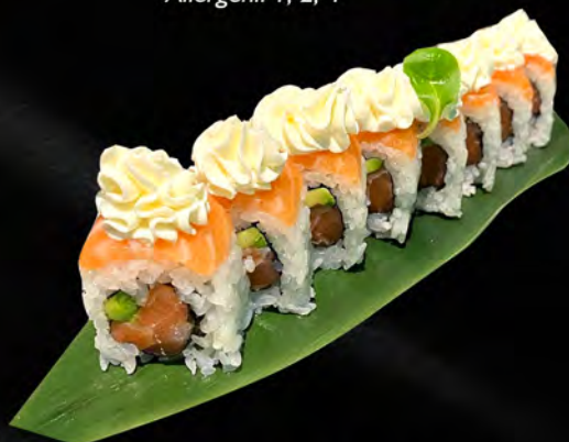
265 - SALMONE ROLL € 11.00 Alghe, salmone, avocado, all'esterno salmone, philadelphia Allergeni: 1, 4, 7