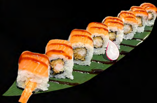
263- TIGER ROLL € 11.00 Alghe, tempura gamberi, all'esterno salmone, teriyaki Allergeni: 1, 2, 4