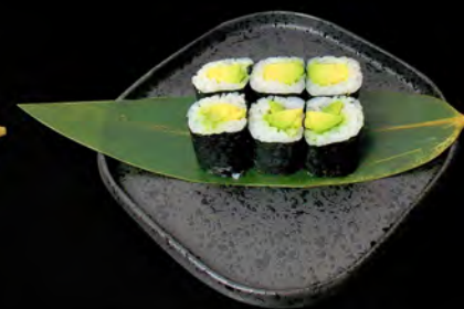
142 - HOSO AVOCADO