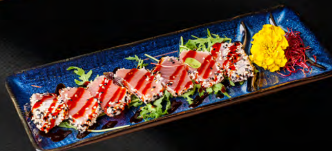
107 - MAGURO TATAKI € 10.00 Tonno flambé con sesamo e teriyaki Allergeni: 4, 6, 11