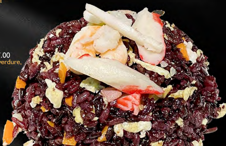
052 - RISO BLACK CON FRUTTI DI MARE € 7.00 Riso venere saltato con verdure, uova e frutti di mare Allergeni: 2, 3, 4, 14