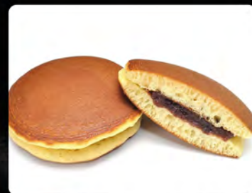
Dorayaki al cioccolato €4.00