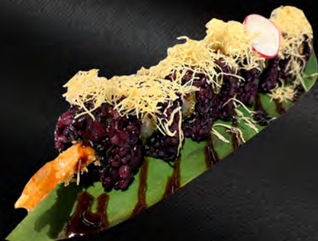
281 - URAMAKI BLACK EBITEN € 10.00 Alghe, riso venere, tempura gamberi, teriyaki, sesamo, kataifi, teriyaki Allergeni: 1, 2, 11