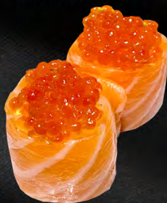
171 - BIGNE IKURA € 6.00 Riso avvolto con salmone ed uova di salmone Allergeni: 4, 15