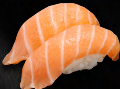
I20 - NIGIRI SAKÉ 2PZ € 4.00 Salmone Allergeni: 4