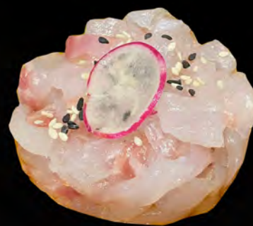
208 - TARTAR SUZUKI € 8.00 Tartare di branzino con salsa ponzu e sesamo Allergeni: 4, 11