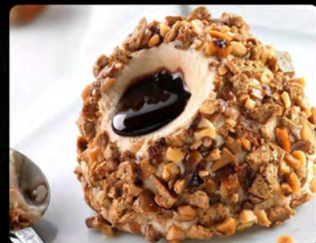
Tartufo nocciola €4.50 Gelato semifreddo alla nocciola con cuore di cioccolato liquido, decorato con nocciole pralinate e meringa.