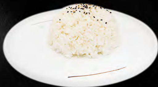
032 - RISO BIANCO € 2.00