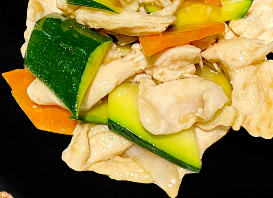
061 - POLLO CON VERDURE € 6.00 Pollo saltato con le verdure miste