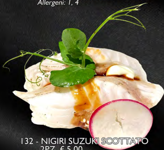
132 - NIGIRI SUZUKI SCOTTATO 2PZ € 5.00 Branzino scottato con salsa teriyaki Allergeni: 1, 4