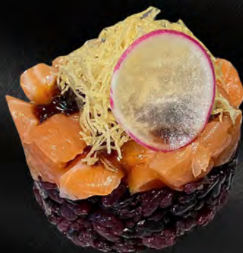
212 - TARTAR RISO BLACK SALMONE € 8.00 Riso venere, salmone, kataifi con salsa teriyaki, philadelphia Allergeni: 1, 4, 7