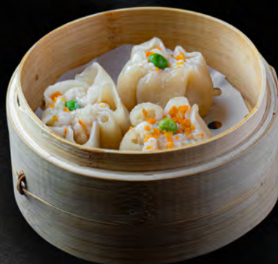
004 - SHAOMAI 3PZ € 3.50 Farina, carne e gamberi Allergeni: 1, 2