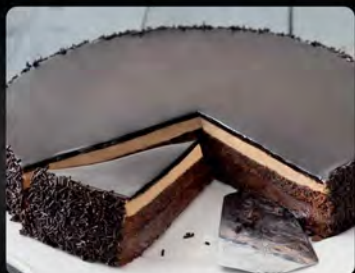
Chocolate temptation €4.00 Crema con cioccolato con cacao monorigine dell'ecuador; crunch alla nocciola e crema alla nocciola.