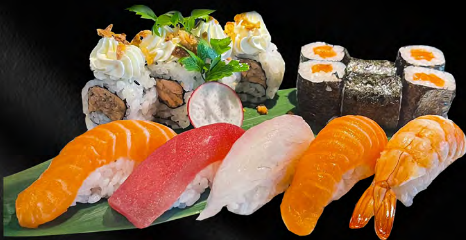
310 - URAMAKI MISTO 15PZ € 13.00 Uramaki 4pz, Hosomaki 6pz, Nigiri misto 5pz Allergeni: 2, 4