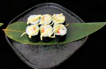
145 - HOSO CALIFORNIA