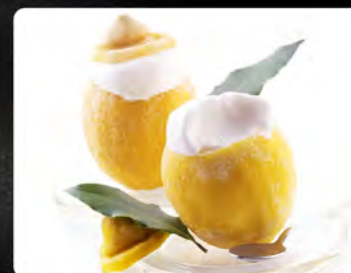
Limone ripieno €4.50 Frutto ripieno con sorbetto di limone.