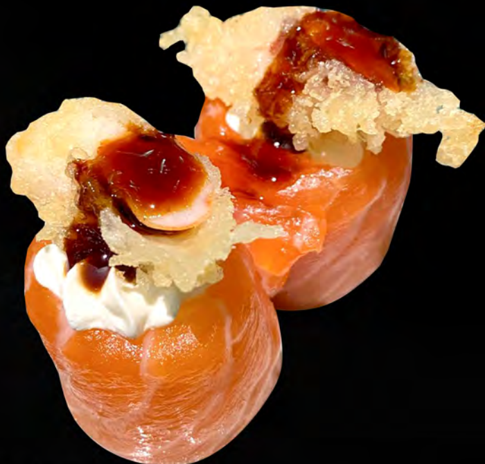
163 - BIGNE EBI € 6.00 Tempura di gamberi, salmone scottato, philadelphia, salsa teriyaki e sesamo Allergeni: 1, 2, 4, 7, 11