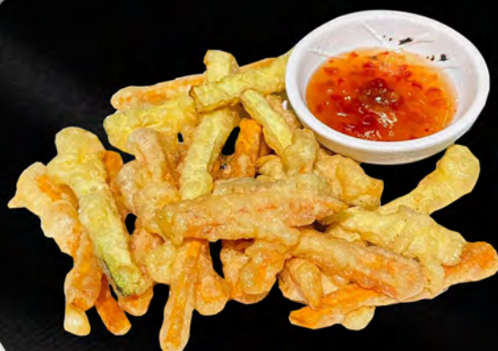
089 - KAKI AGE € 6.00 Verdure miste tagliati sottili fritto Allergeni: 1