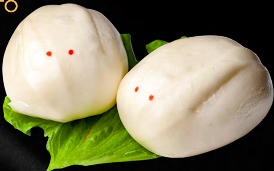
006 - PANE CREMA 2PZ € 4.00 Pane soffice con crema all'uovo dolce Allergeni: 1, 3, 7