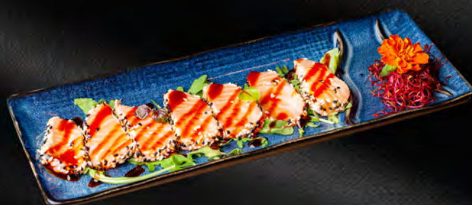
106 - SAKÉ TATAKI € 9.00 Salmone flambé con sesamo e teriyaki Allergeni: 4, 6, 11