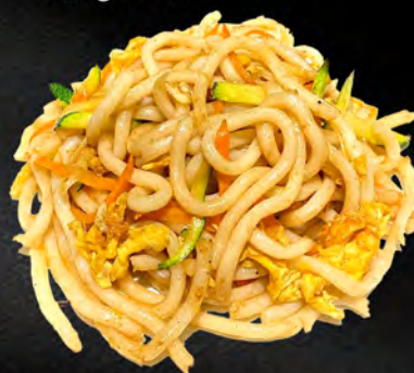
043 - YAKI UDON CON VERDURE € 6.00 Udon saltato con verdure mista ed uova Allergeni: 1, 3