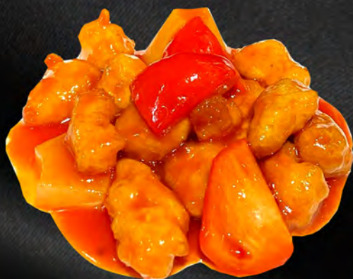
063 - POLLO IN AGRODOLCE € 6.00 Pollo fritto in agrodolce con ananas e peperoni Allergeni: 1