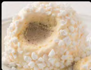
Tartufo bianco €4.50 Gelato semifreddo allo zabaione con cuore di gelato al caffè decorato con granella di meringa.