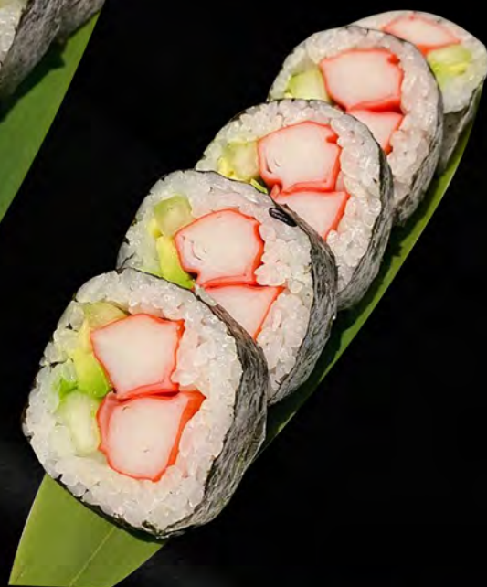
151 - FUTO CALIFORNIA € 8.00 Futo con surimi di granchio ed avocado Allergeni: 2