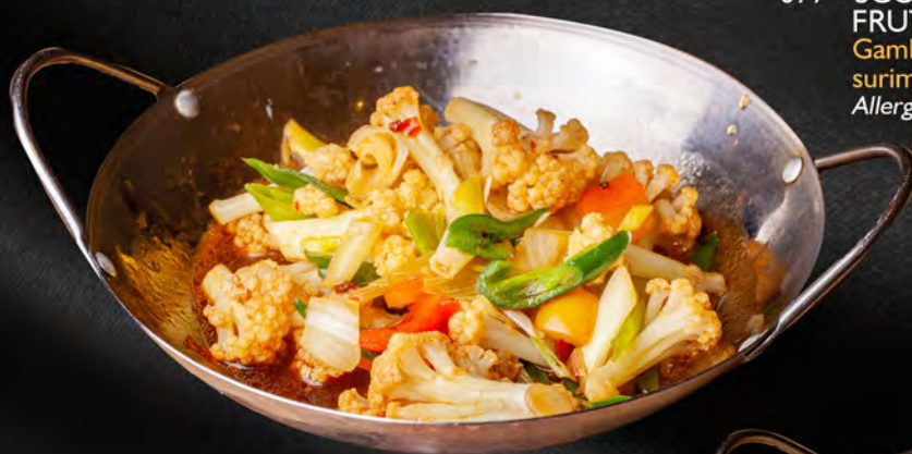
078 - SCODELLA DI FUOCO CON CAVOLFIORE € 7.00 Cavolfiore, cipolla, peperoni