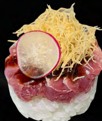
211 - TARTAR RISO TUNA € 9.00 Riso con tonno, kataifi con salsa teriyaki Allergeni: 1, 4