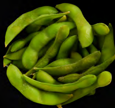
012 - EDAMAME € 4.00 Baccelli di soia bolliti Allergeni: 6