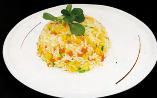
033 - RISO CON VERDURE € 4.00 Riso saltato con verdure miste ed uovo Allergeni: 3