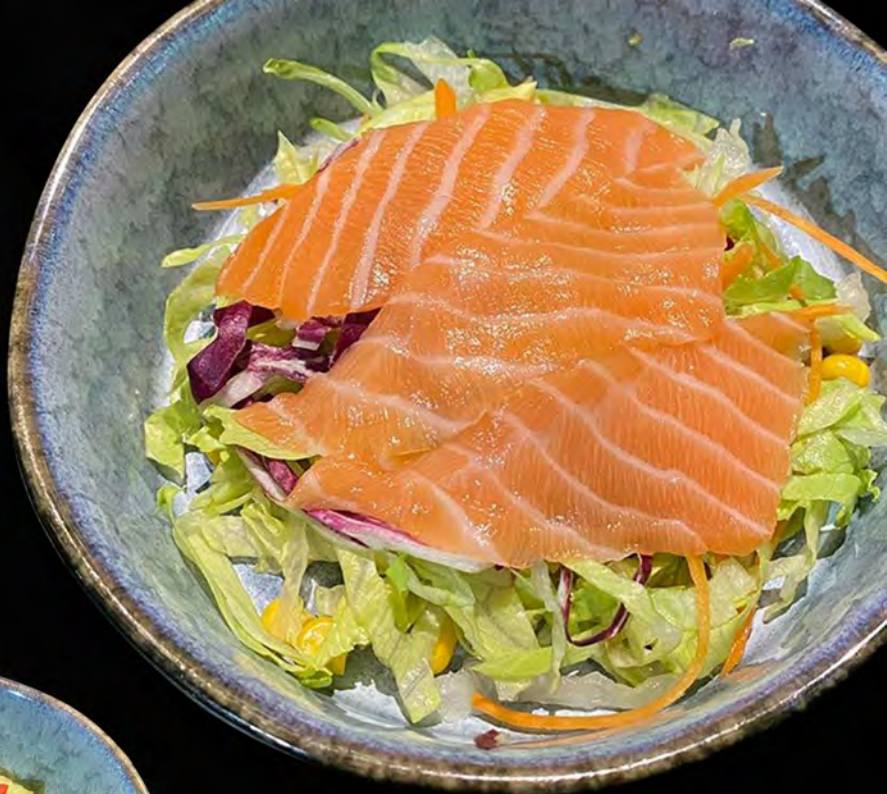
021 - INSALATA SAKE € 5.00 Insalata mista con salmone crudo e salsa di verdure Allergeni: 4