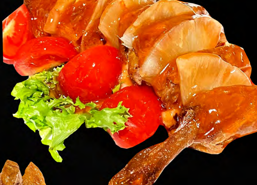
076 - ANATRA AGRODOLCE € 8.00 Anatra in salsa agrodolce con ananas e peperoni