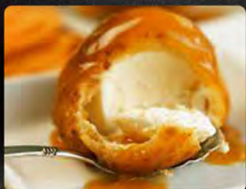
Gelato fritto vaniglia €4.00 Farina, gelato alla vaniglia. Gelato fritto nocciola €4.00 Farina, gelato alla nocciola.