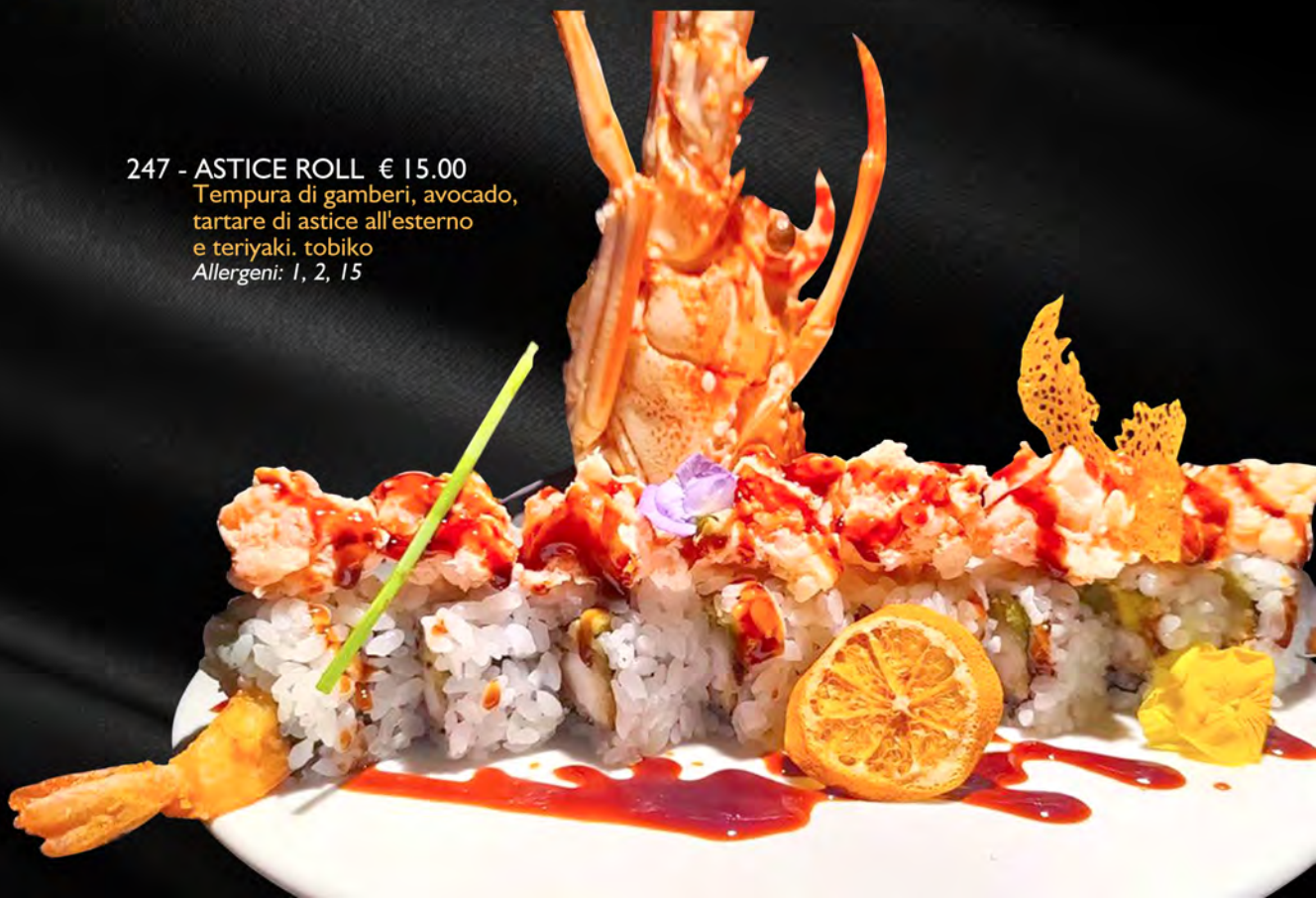
247 - ASTICE ROLL € 15.00 Tempura di gamberi, avocado, tartare di astice all'esterno e teriyaki. tobiko Allergeni: 1, 2, 15